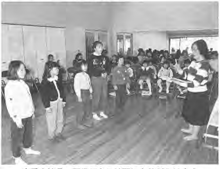
本番を控え、配役ごとの練習にも熱が入ります

曜日の午後、サンパセオ新柏のコミュニティルームで行っています。練習は、まず発声から。その後、簡単な曲を合唱して、季節感のある歌や情緒豊かな歌などへ進みます。