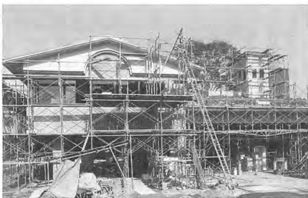
12月下旬の完成を目指し工事が進む西原分署

この基本計画に基づき、こた、柏の葉・伊勢原・西原などのたび新築される西原分署の地域です。同分署の開設計画は、西原地区の著しい人口増加や、常磐自動車道の開通・米軍柏通信所跡地等の北部開発に伴う、消防需要の増大に、対応しようとするものです。同分署は今後、市北西部地域の消防・防災拠点となり この基本計画に基づき、こた、柏の葉・伊勢原・西原などのたび新築される西原分署の地域です。同分署の開設計画は、西原地区の著しい人口増加や、常磐自動車道の開通・米軍柏通信所跡地等の北部開発に伴う、消防需要の増大に、対応しようとするものです。同分署は今後、市北西部地域の消防・防災拠点となり