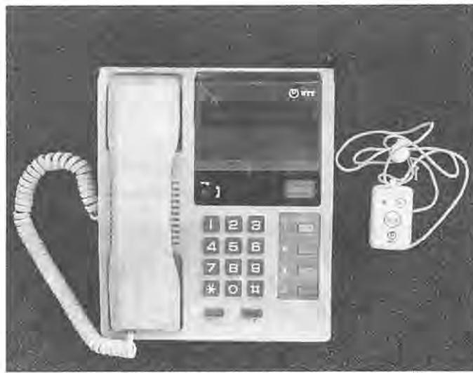
電話とペンダントの緊急通報システム