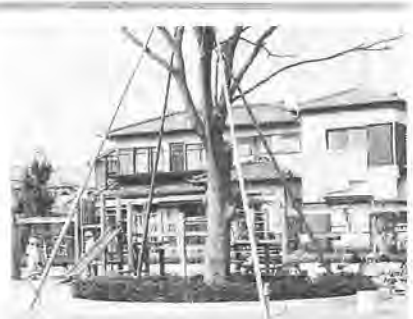
豊町第二公園が完成 整備工事を進めていた、豊町第二公園が完成。早速、近所のかたが、子ども連れで訪れています。中央にそびえる大きなケヤキが、この公園のシンボルです。□所在地=豊四季季低見台642

昭和六十一年度に策定した「柏市アメニティ・タウン計画」では、利根川・手賀沼を始めた水辺・広がりのある田畑・連続する斜面が広がる、市の北部・東部地域等を「緑水アメニティゾーン」と位置づけ、豊かな自然と親しむことのできるルートづく(柏・北柏)と県立柏の葉公園が完成。