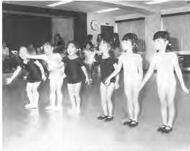
スタジオにかわいい歌声が響きます

わが子が元気に歌ったり、踊ったりする姿を見ることは、親にとっても楽しいことではないでしょうか。今回紹介する「子どもミュージカルスタジオ」は、そのような親が発起人となり、昭和六十三年に結成されました。