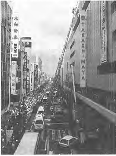
はしご車を使っての救出訓練