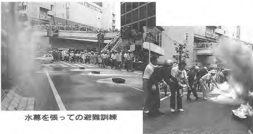
水幕を張っての避難訓練

「防災の日」の九月一日、柏駅周辺で、大がかりな防災訓練が行われました。買い物客などが行き交う、駅周辺での初めての防災訓練。今号は、その訓練内容を写真でご紹介します。