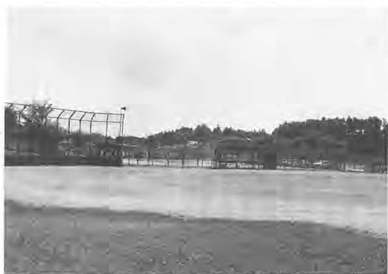
夜間照明が設置される予定の総合運動場

●平成元年度柏市水道事業 平成元年度の一般会計の決算は、実質収支で約二十六億二千七百万円の黒字になりました。