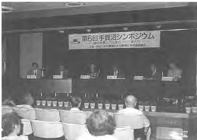
まちづくり美人の将来を話し合うパネリストの皆さん