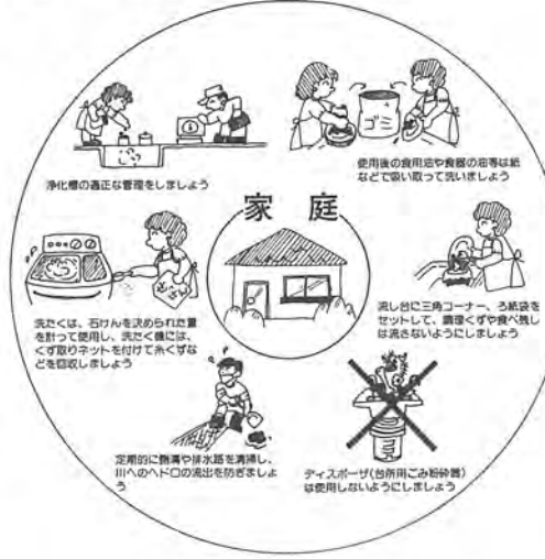
家庭でできる浄化対策

わたしたち日本人の食生活も西洋化が進み、食用油を多用する料理が多くなりました。逆に、牛乳パック一杯分(五〇〇ミリリットル)の天ぷら油を台所に流したとすると、これをコイやフナが住める程度の水質に取り戻すには、一〇〇キロリットルの水が必要になります。これは、浴槽三百三十杯分の水に相当します。 また、若い人たちの間で流行している、モーニング・シャワーの習慣、シャワー時のボディー・シャンプーの使用等、わたしたちの生活の変化が河川・海の汚濁という大きなツケをもたらすことに気付かなければなりません。 わたしたちが生活しているうえで、当然排出される家庭排水の問題は、一人ひとりが「いかにして自分が出す水の後始末をするか」という自覚を持つことが何よりも重要です。