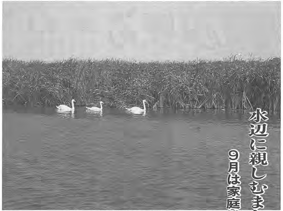
白鳥も安心して暮らせる手賀沼に

手賀沼の汚濁の約八〇％は、家庭の台所や風呂場などから流れ出る家庭排水によるものです。そこで市では、この家庭排水を浄化するため、市民の皆さんの理解と協力のもと「家庭でできる浄化対策」(別図1)を推進してきました。