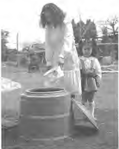
コンポストでごみの減量を

校生の性意識と行動 ④高校生クラス 原則として高校生を持つ親、内容は①子どもの将来と進路②高校生の心理③高