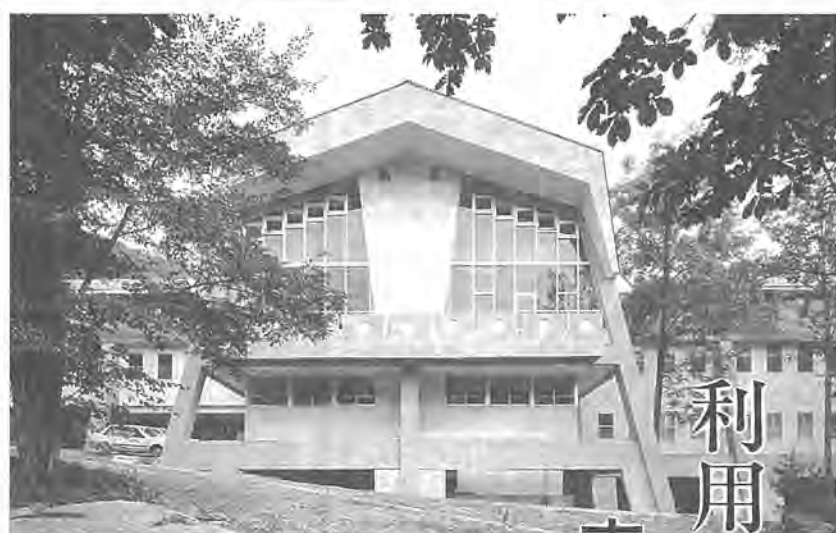
遅い春を迎えた菅平かしわ荘

◎ ふるさと村交流 昔、ふと、どこかで出会うたことのあるような、恵まれた自然と素朴な風情にふれることができる「ふるさと村」。