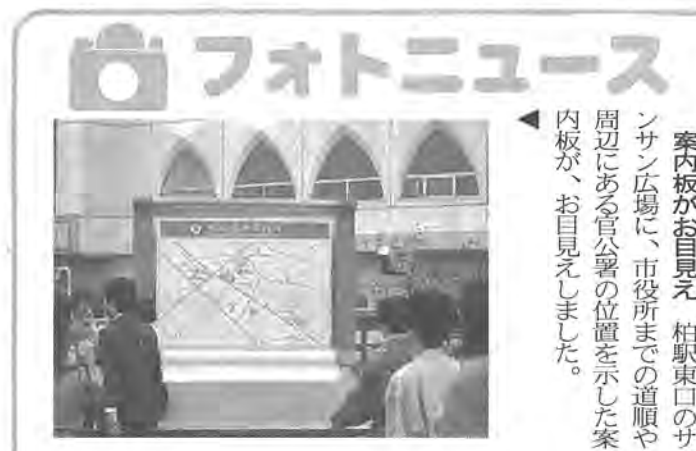
案内板がお目見え 柏駅東口のサン広場に、市役所までの道順や周辺にある官公署の位置を示した案内板が、お目見えしました。

わたしたちは、豊かな緑と水をまもり、潤いのある住みよい柏をつくるためにこの憲章を定めます。 1 たがいに話し合っ、心のがよう明るい柏をつくりましょう 1 老人を敬い子どもを愛する、あたたかい柏をつくりましょう 1 環境をととのえ、安全できれいなまち・柏をつくりましょう 1 教育を重んじ、健康で、文化の薫り高い柏をつくりましょう 1 国際理解を深め、平和な柏をつくりましょう