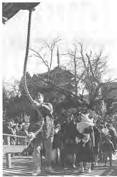
たくさんの善男善女でにぎわった紅竜山東海寺

平成になって初めての年末年始は、穏やかな天候に恵まれましたが、市民の皆さんは、どう過ごされましたか。正月の柏の街にも正月ならではの表情が見られました。