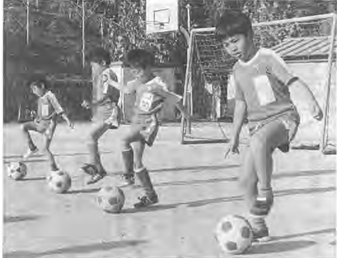
基本動作の練習をする皆さん

「バス、行くよ」「オッケー」。元気なチビっ子たちの掛け声がグラウンドに響きます。 このクラブは、昭和六十年四月に、スポーツが嫌いな子どもでも、楽しく参加できるようにと小学生の男子を対象に、結成されました。現在会員は三十七人。毎週土曜日午後二時から五時まで、富勢東小学校グラウンドで活動しています。 同クラブは、昭和六十二年十月に行われた市長杯大会六年生の部で、三位入賞を果たしたのをはじめ、これまで過去三回、三位入賞と好成績をあげています。