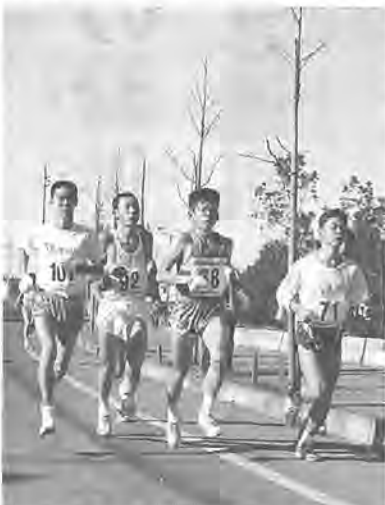
新春の日ざしを受けて、力走する皆さん

一月一日、市民元旦(がんばり)マラソン大会が、県立柏の葉公園周辺道路を会場にして行われました。