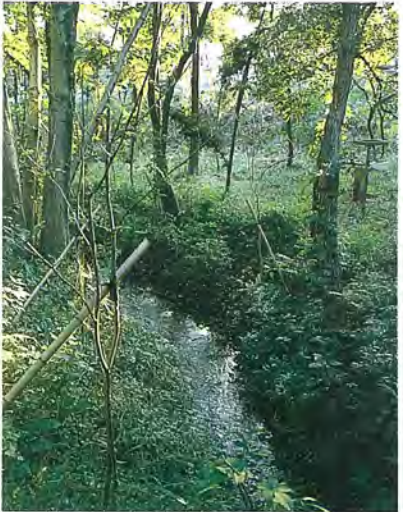
整備・保存された湧水

東京大学卒。各地の地域開発計画・都市計画の立案に従事。市制施行35周年記念シンポジウムでコーディネーターをつとめるなど、柏市のまちづくりに参画。