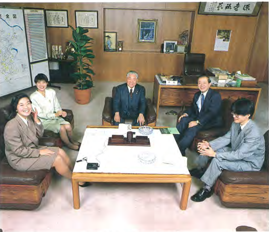
座談会に出席された皆さん

平成元年、第16回柏市派遣交換青少年としてカリフォルニア州トーランス市を訪問。青山学院大学在学。