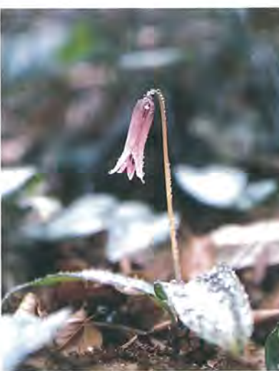
かれんに咲くカタクリの花

担当して一番感じたことは経済的には活気があつていいんですが、何か雑然として、市民の気持ちがバラバラなんです。それと、自然環境が悪くなつていましてね。みんな我々がやってしまったわけですが、自分の住んでいる区域は、自分たちの手で何とかしなくてはという、市民意識を持っていたことが大切ですね。そこで私は、意識革命の必要性を考え「ふるさとづくり」を始めたわけなんです。はじめはなかなか理解してもらえず、ずいぶん苦労しましたね。