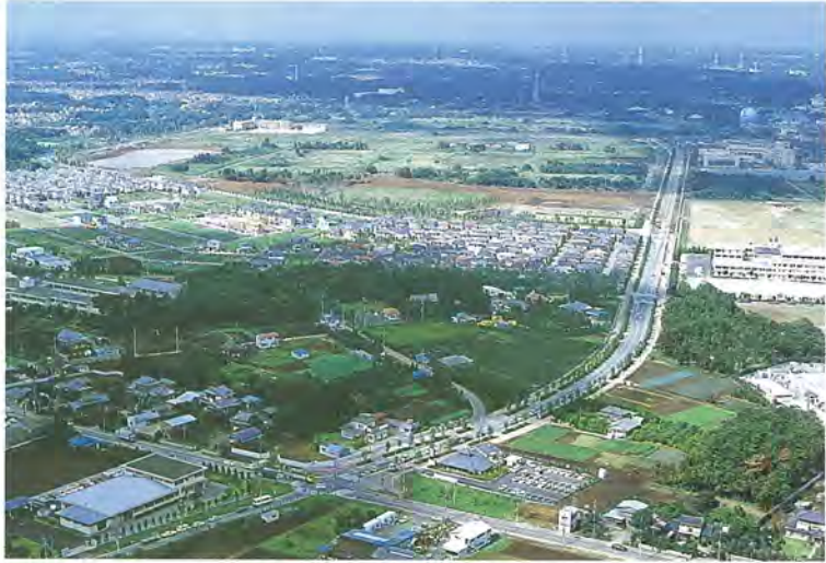
新しい核に生まれ変わる北部地域

若い若下さんと神鳥さんをお招きし、柏市の将来のまちづくりについて座談会を行いたいと思います。