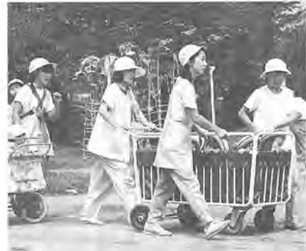
低年齢児はサークル車で避難 これは、六都府市総合防災訓練の一環として毎年行われているもので、柏市の防災訓練は今年で十一回目を数えます。午前十時、打ち上げ

図られ、第三セクター設立に向けて鋭意準備が進められています。県では、特別措置法に規定されている基本計画を策定するため、庁内の連絡会議で調整が図られています。また、新線沿線の新たな都市形成の在り方を検討し、今後予想される市街地整備事業を円滑に推進するための、県の方針づくりを目的とした調査も行われる予定であり、今後、国・県などの動向に留意し、まちづくりに対する市の考え方が、計画の中に充分反映されるよう働きかけていくとともに、引き続き事業化に向けた調査を進めていきます。