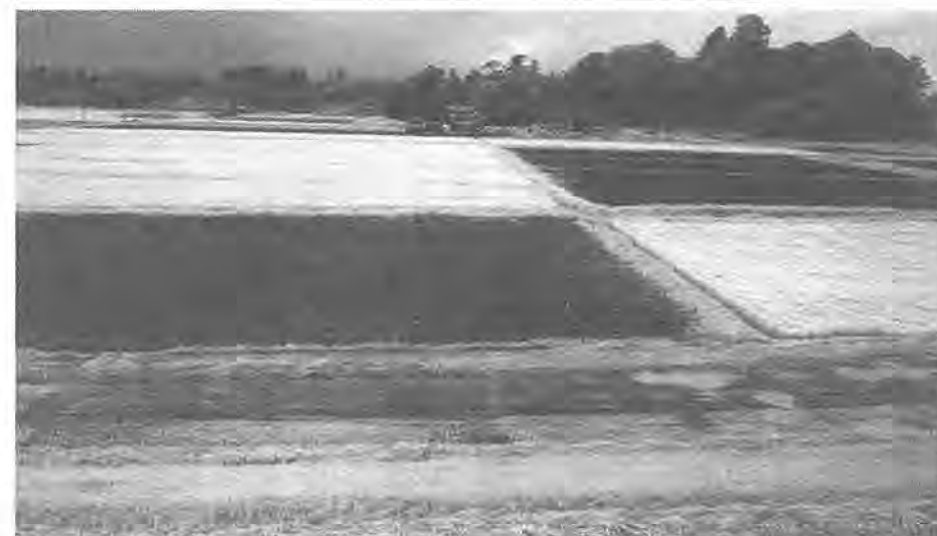
利根川第二堤防からふるさと農園予定地を望む(赤外線フィルムで撮影)

二・〇坪の開きよを敷設するもので、約三億一千四百万円を請負契約を締結しようとするものです。