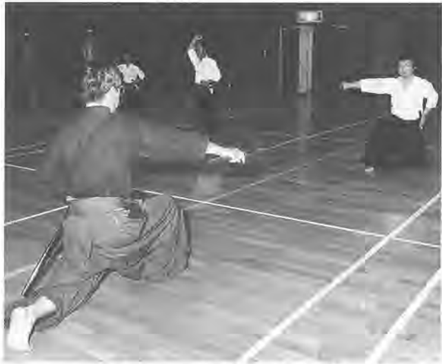
エイノ呼吸を整え刀をひと振り

ヒュー！空を切る刀の音。ドン！床を踏みしめる足の音……。松葉近隣センターの体育館。真剣な表情で刀を振りかざしているのは「居合道同好会」の皆さんです。発足は、昭和六十年。会