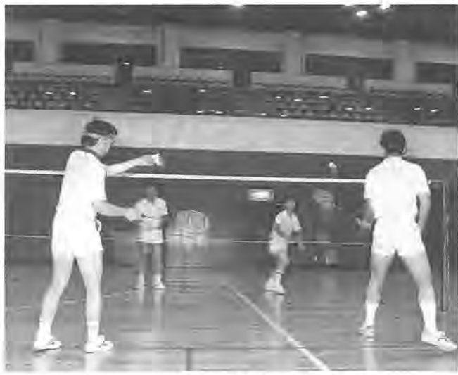
市民大会へ向けて、練習に励むメンバー

「パーン、パーン」、かろやかなリズムで、シャトルを打つ音が、体育館に響きわたります。 「パドミントン教室」の修了生有志が集まって結成されました。活動は、毎週火・木・土曜日の午後六時半