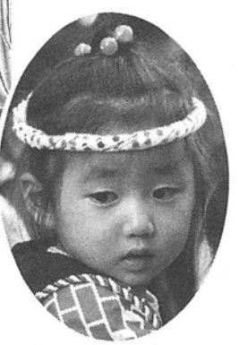
おまつり大好きちゃん

今年の柏まつりは、七月二十九日、三十日に行われました。市制施行三十五周年、人口三十万人突破という、記念すべき年であったこともあり、まつりは大いに盛り上がりました。また二日間の人も、六十五万人と過去最高で、柏駅東西のイベント会場周辺では、歩くことができないほどでした。'89柏まつりカメラ散歩では、イベントの中からいくつかをピックアップして、写真で紹介いたします。