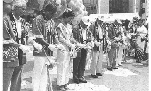
テープカットにはミスグナムも特別参加