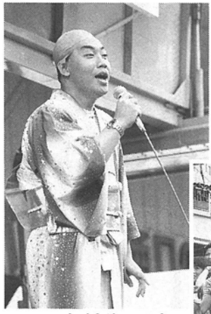
コロケはやっぱり若者たちの人気者

祭の花はなんと言ってもおみこし。若い女性の「セイヤ・セイヤ」のかけ声に雰囲気も盛り上がりました