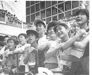
コロケの名演技にうっとり