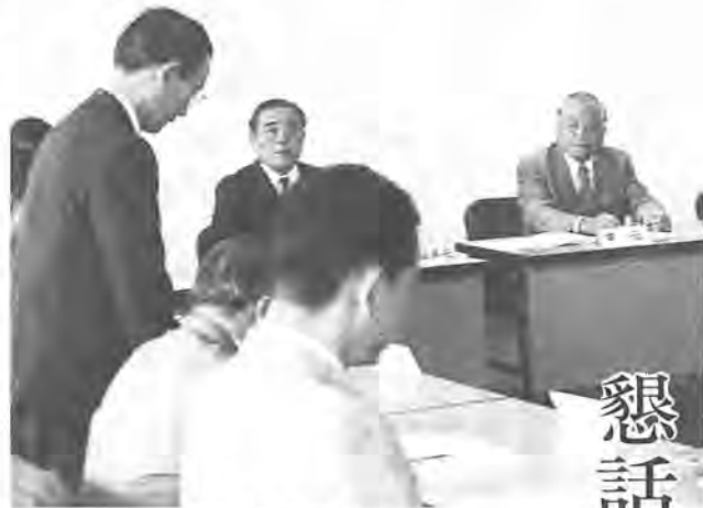
初めて開かれた懇話会