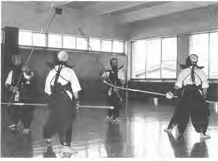
いい汗かいて、心身ともにさわやかに