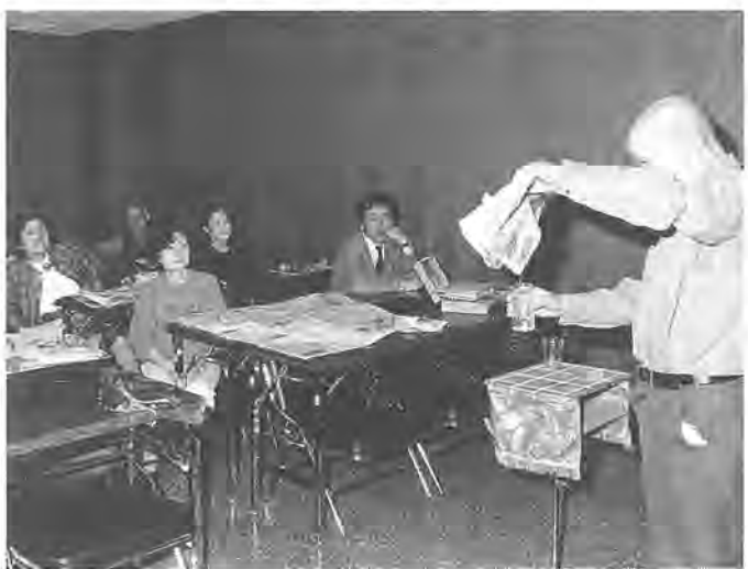
メンバーの前での実演はちょっと緊張感が...

軽快な音楽にのって、あざやかな手つきで手品を披露しているのは、柏マジックグループの皆さん。 発足は、昭和六十二年六月。手品が大好きな人たち