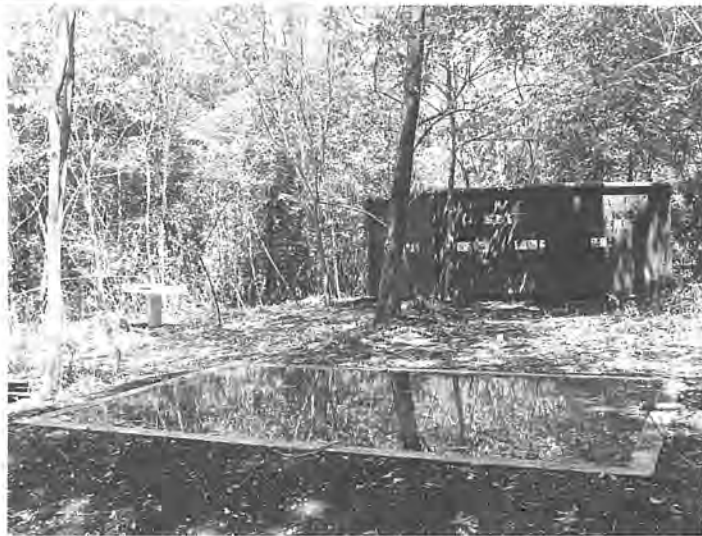
鳥たちの生態が間近で見られます