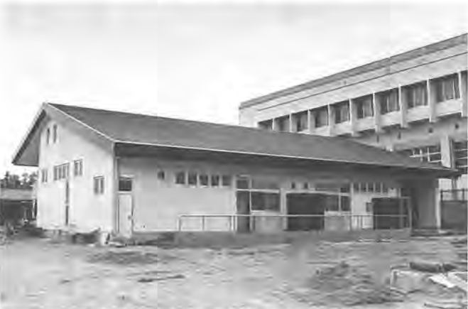
設備が充実し利用しやすくなりました (5月1日撮影)

バードウォッチングは、自然の中で鳥を見たり、声を聞いて楽しむものです。観察は、少人数で、早朝に出かけます。現地に到着したら静かに行動し、動きまわらないことが大切です。服装は地味なものを着用します。そして、七倍から十倍の倍率を持つ双眼鏡と、身近な鳥をくわしく解説してある図鑑を用意するとよいでしょう。皆さんの中で、いつも身近に鳥とのふれあいを持ちたいかたは、庭の片すみにえさ台を置き、家の庭をミニサンクチュアリにして、小鳥たちを集めて観察する方法もあります。