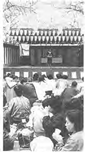
恒例のカラオケ大会

今年も、四月八日・九日の両日あけぼの山公園を会場に「桜まつり」を開催します。そこで、恒例の催しになっている素人カラオケ大会の参加者を募集します。あなたも、この機会に、桜の木の下で歌ってみませんか。 とき 4月9日(日) 正午から ところ あけぼの山公園内特設ステージ 対象 市内在住・在勤のかた、先着二十五人 申し込み 3月22日