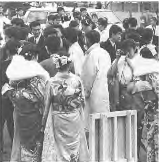
晴れ着を着てハイ、ポーズ