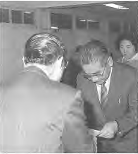
長山助役から委嘱状を受け取る収納員

に関する文書を配ったりして、国民健康保険料の収納率を、市と加入者のパイプ役を向上を図るため、本年度から保険料収納員制度を発足させます。収納員は、二月一日から昭和六十三年年度の国民健康保険料を未納しているかたを対象に、訪問を開始します。みなさんのご協力をお願いします。