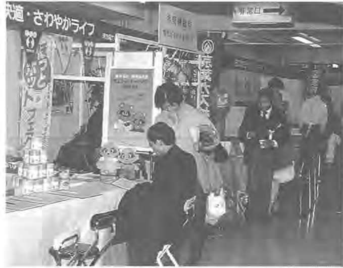
役立つ情報がいっぱい（昨年の消費生活展から）

この消費生活展は、市内の消費者団体などが調査研究した成果を広く市民のかたがたに知ってもらうため、毎年行われているもので、十八回目を数える今回のテーマは、「あまくてから砂糖のお話」。