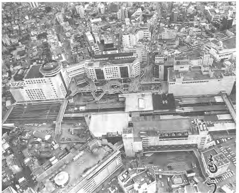
住みよい柏をつくるため税金は使われています