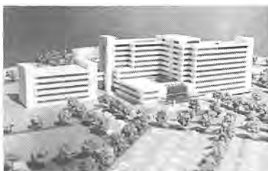
国立第二がんセンター完成予想図

同跡地の中央に建設される国立第二がんセンターは、約四五和五十九年から誘致に乗り出し、昭和六十二年、同跡地に