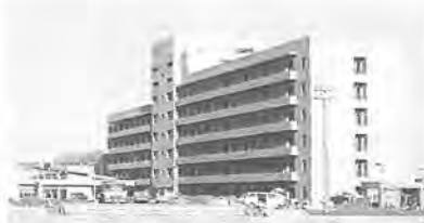
大蔵省税関研修所(建設中)

●千葉大学園芸学部附属農場 二五㊟の敷地に、園芸園、花き園、実習緑地、温室、管理棟、作業棟など。二