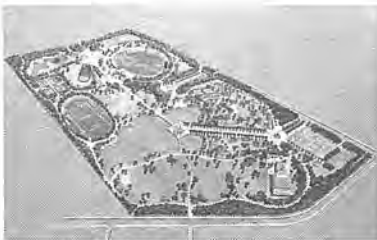
柏の葉公園完成予想図