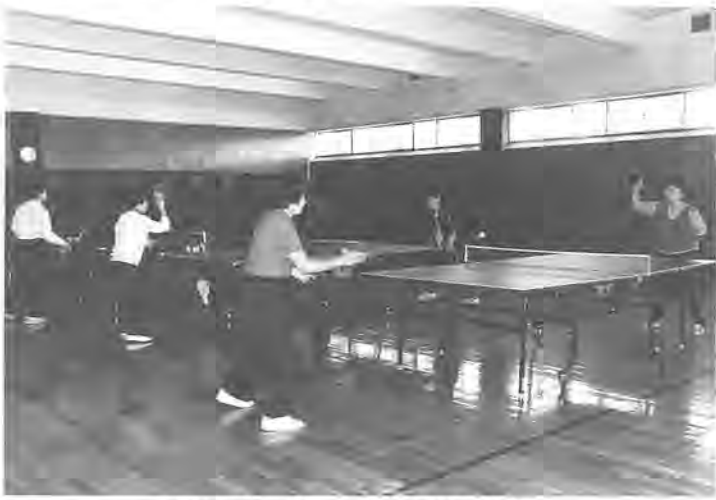
額に汗。練習にも熱が入ります

市民体育館の剣道場全体にピンポン球のリズミカルな音が、響きわたります。ラケットを片手に、ラリーの練習。額には、キラリと