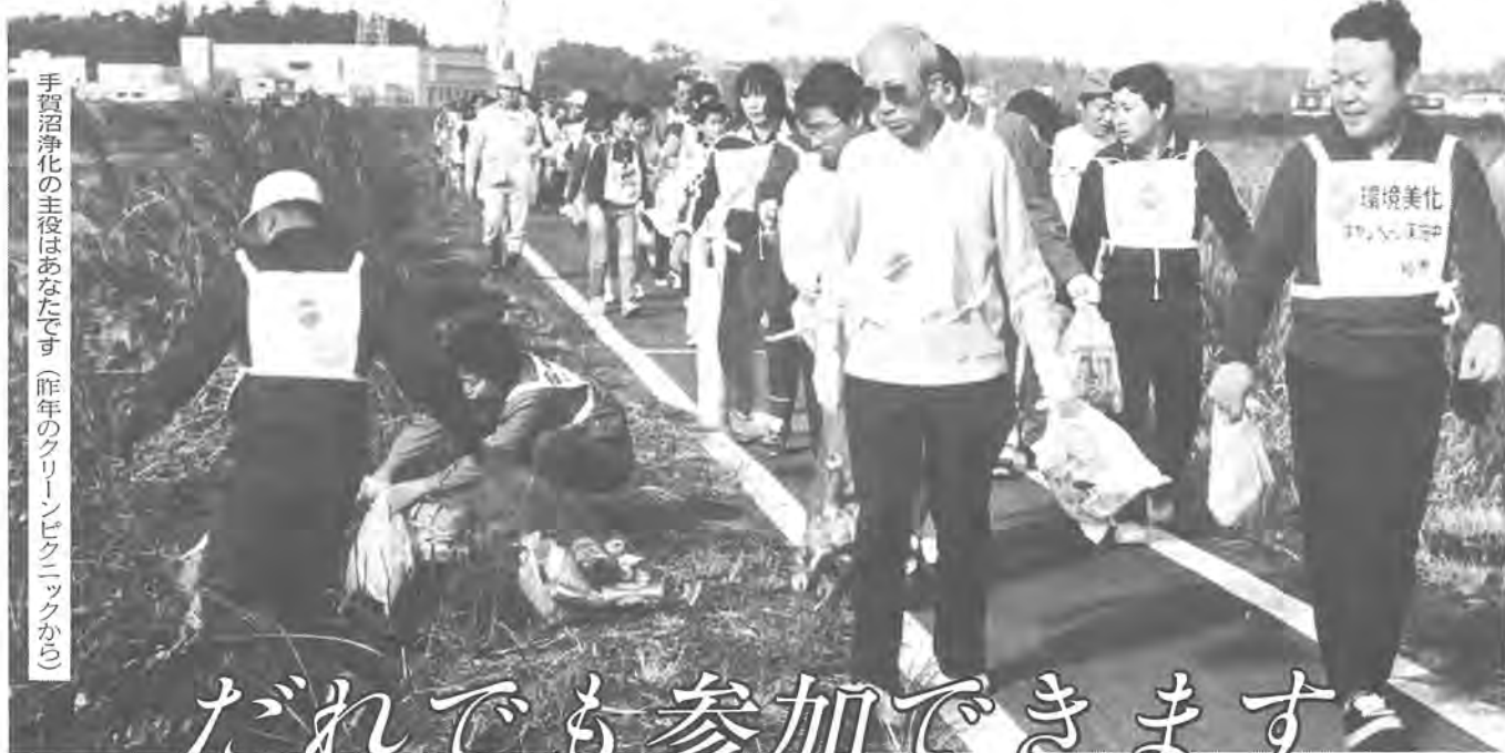
手賀沼浄化の主役はあなたです(昨年のクリーンピクニックから)

わたしたちは、豊かな緑と水を守り、潤いのある住みよい柏をつくるために、この憲章を定めます。 1. だいに話し合っ、心のかよう明るい柏をつくりましょう。 1. 老人を敬い子どもを愛する、あたたかい柏をつくりましょう。 1. 環境をととのえ、安全できれいなまち・柏をつくりましょう。 1. 教育を重んじ、健康で、文化の薫り高い柏をつくりましょう。 1. 国際理解を深め、平和な柏をつくりましょう。