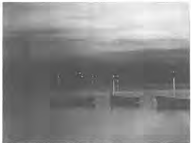
《第4回ふるさと柏写真展から》 作品はカラー