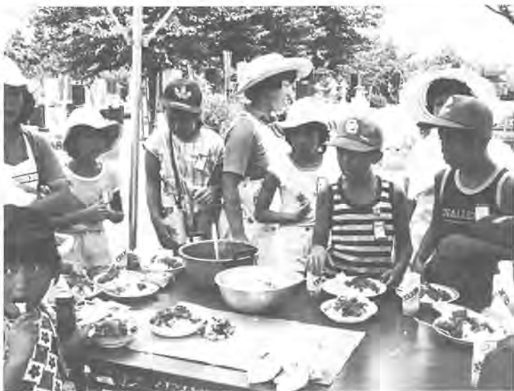
出来上がったカレーライスを前に、「さあ、みんなで食べよう」

六つのチェックポイントを設けたウォーク・ラリー方式を採用して登山。山を降りた八日の夜は、ロッジでキャンプファイアーを楽しみました。「また参加したい」と話す子どもたちの目は輝いていて、評判も上々でした。