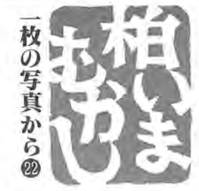
一枚の写真から② 昭和24年6月1日、柏駅前、常磐線の電化を祝う小学生らの旗の波

松戸―土浦間に予定されていた電化計画は、翌年起こった日華事変などの影響で、中止されてしまいました。 しかし、戦後になると、車両が劣悪なこともあって、ラッシュ時には列車から振り落とされることが出るなど、不幸な事態も発生しました。そのため、昭和二十二年には常磐線電化促進連合委員会が結成され、鉄道がGHQに管理される中で、GHQや運輸省などに熱心な働きかけが行われました。 昭和二十四年六月、それまでの活動が実り、松戸―取手間が電化され、沿線住民の喜びは計り知れないほどだったといえます。その常磐線も、今や、朝夕のラッシュ時には超満員。常磐新線の建設が待たれています。