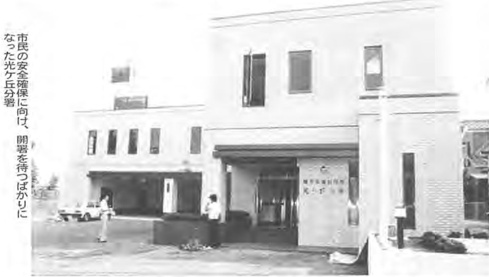
市民の安全確保に向け、開署を待つばかりになった光ヶ丘分署

分署(所在地は柏市東中新宿四丁目四一―二五)が完成しました。今年一月から建設工事が行われていたもので、業務の開始は、当初計画していた十月一日よりも早まって、九月中旬の予定です。柏市は、昭和二十九年に市制施行以来、首都近郊の中核的都市として発展してきました。その間、人口が著しく増加し続け、また、都市化に伴って市街地は住宅が密集するようになり、火災や地震など万一の災害の発生に備えて、市民の生命・財産を安全に守る体制を整えることが防災上急務とされてきました。そのため、昭和五十四年九月には、十余二の国道十六号線沿いに消防新庁舎を建設し、「消防本部・西部消防署」として業務を開始するとともに消防力の向上に努めてきました。