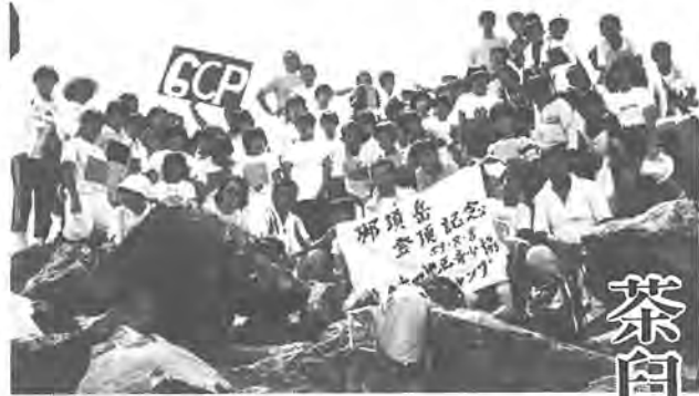
全員で登頂しました那須・茶臼岳