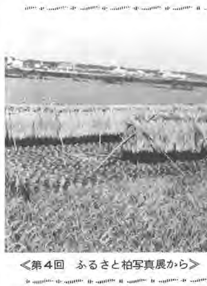
＜第4回 ふるさと柏写真展から＞ 作品はカラー

柏保健所では、昭和五十六年四 月一日から同九月三十日まで生 まれた幼児を対象に、調査票によ る三歳児健康診査を行います。該 当者には調査票を郵送しました が、今年四月一日以降に転入され たかたや調査票が届かないかた は、はがきに転入年月日・旧住所 (以上は転入者だけ)・現住所・ 電話番号・保護者名・幼児名とそ の生年月日を明記して、〒277 柏市柏二五五 柏保健所 三歳児 係へお申し込みください。 ○問い合わせ 柏保健所67- 一三五五へ。