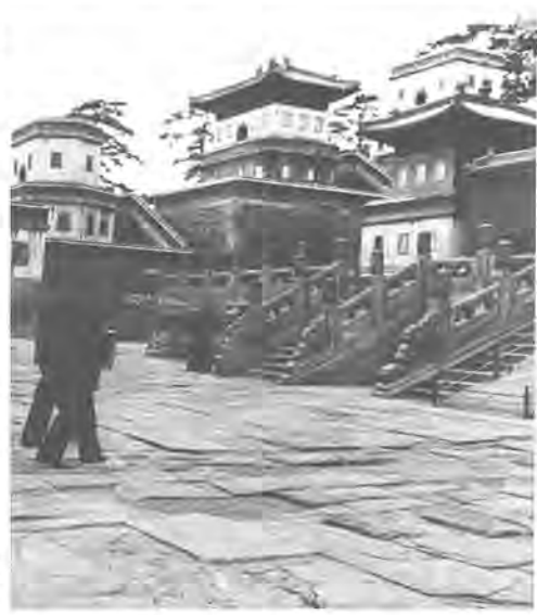
承德市の歴史的遺産ともいえる普寧寺境内

柏市・承德市友好都市交流委員会では、八月十八日から同二十六日までの日程で、中国・承德市に「日中友好・柏市民の翼」訪中団」を派遣することに決め、現在、その団員を募集しています。 柏市と承德市が昨年十一月一日に友好都市となつて、今年、両市に於ける「友好交流元年」ともいえ、しかも、柏市にとっては市制施行三十周年という、節目の年でもあります。 この記念すべき年に、両市の市民が友好親善を深めることは、いっそう意義深いものとなることでしょう。皆様の参加をお待ちしています。