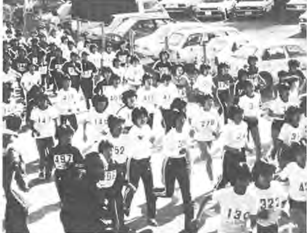
《第3回ふるさと柏写真展から》 作品はカラー