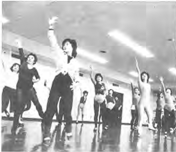
軽快なリズムに乗って、ロイズダンスクラスのみなさんはきょうもシェイプアップ

トレーニングウェアやキュロット、それに色とりどりのレオタードなど、様々な衣装に身を包み、外の寒さを忘れさせるかのように練習に励む、「ロイズ」メンバーは、三十代から六十代まで多様で、総勢四十五人。