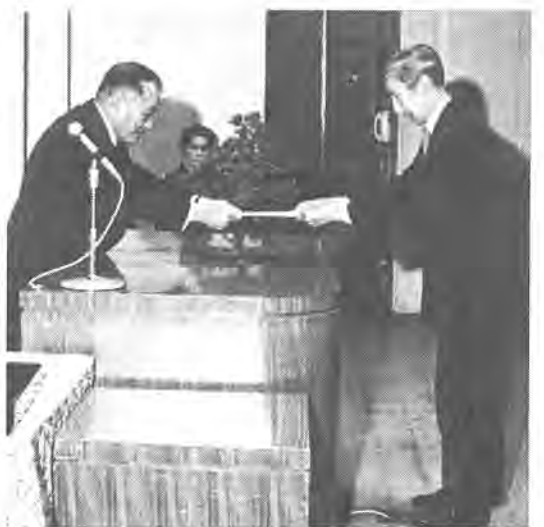
市長から委嘱状の伝達を受ける 民生・児童委員の代表

このたび、新しい民生委員として二百三十八人のかたが決まり、十二月一日付で厚生大臣から委嘱されました。