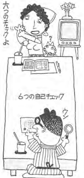
六つの自己チェック