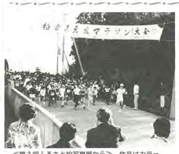
《第3回ふるさと柏写真展から》 作品はカラー