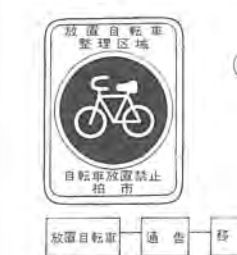
■別表2 自転車駐留場の設置基準