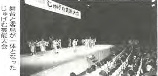
舞台と客席が一体となった じゅげむ芸能大会