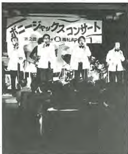
ボニージャックスのすばらしいハーモニーも流れました

十一月十九、二十日の二日間、教育福祉会館全館を使って「第二回柏っ葉福祉まつり」が開かれました。