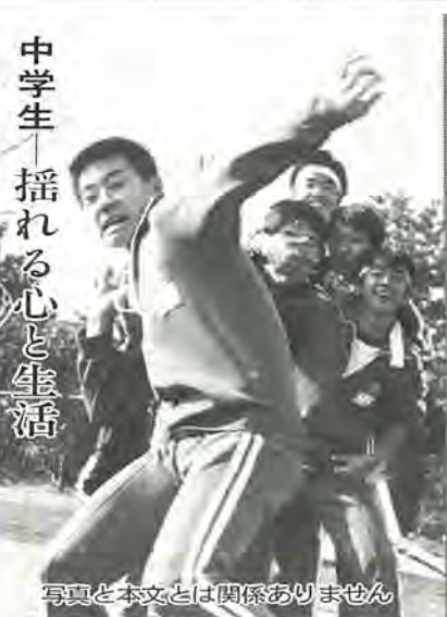
写真と本文とは関係ありません