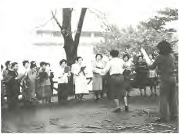
《第3回ふるさとと柏写真展から》 作品はカラー