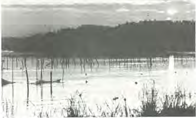
《第3回ふるさと柏写真展から》 作品はカラー