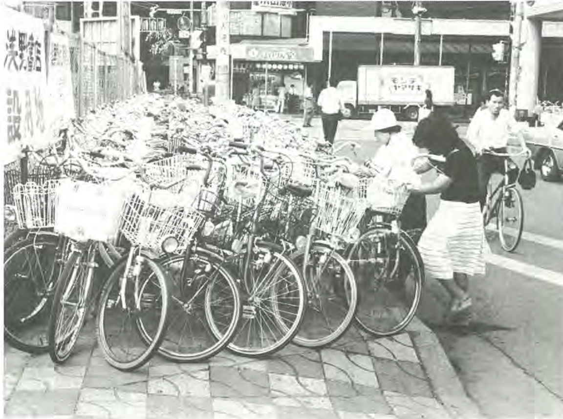
整備されたカラー歩道にも自転車がはいっぱい。これでは歩行者も車道を歩くしかありません。柏駅東口で。

市内の国鉄・私鉄各駅前を中心にして、道路や歩道に放置されている自転車は約七千台にものぼります。 これらの放置自転車は、歩行者や車の交通妨害になるばかりでなく、災害避難時などの安全確保に、大きな障害となることが予想されます。 自転車の放置を禁止する整理区域の指定、大型店舗等の新増築に際する自転車駐車場設置の義務付けなどを内容とする「柏市自転車の放置防止に関する条例」が、来年四月から施行されるといっても、放置自転車問題の解決には、自転車利用者一人ひとりの協力が必須です。ちょっとした心掛けて、