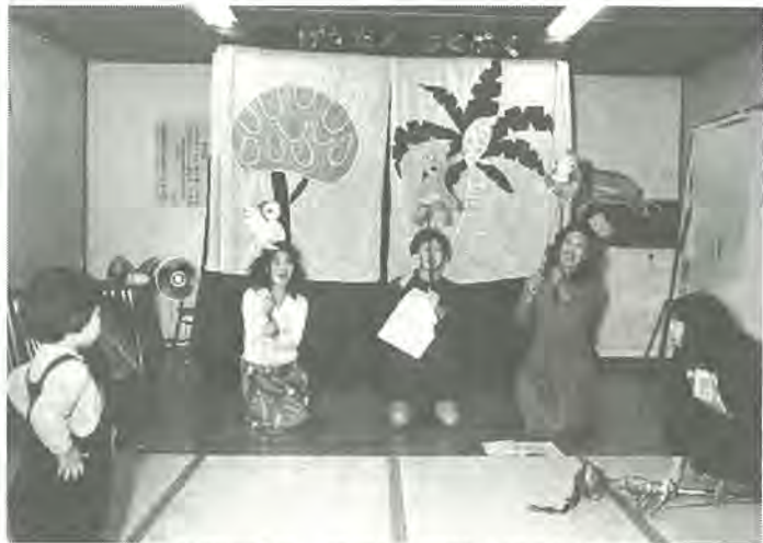
次回の公演に向け、アフリカ民話「アナンシと五」の練習に励む、お母さん団員

「見ている子供を主役に据え、子供との対話を大切にして劇を進行させますので、子供が乗り過ぎて大騒ぎになり、劇がストップすることたびたびあります」という公演は、いつも大勢の子供たちの歓声につつまれます。