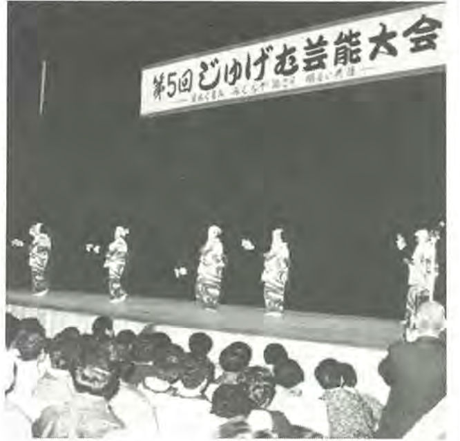
舞台と客席が一体になって芸の数々を楽しめます — 昨年のじゅげむ芸能大会から