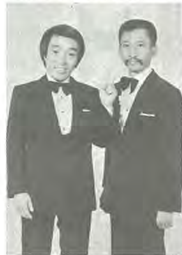
漫才のWエースも出演