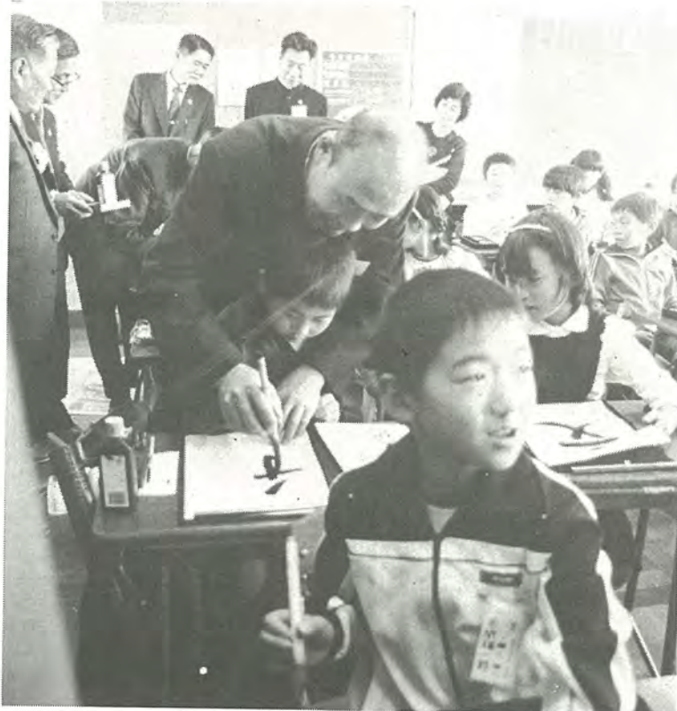
▲11月1日、午後からは、逆井小を訪問し、約千人の児童から盛大な歓迎を受けました。各クラスを回った団員たちは、どのクラスでも興味深げに授業を見学、特に書道の授業を行っているクラスでは、自ら筆を取って友好を深めました。

▶11月3日は文化の日。代表団一行は、市内の文化祭を見学し、教育福祉会館にある中央公民館では、茶道のお点前で日本の文化に触れました。