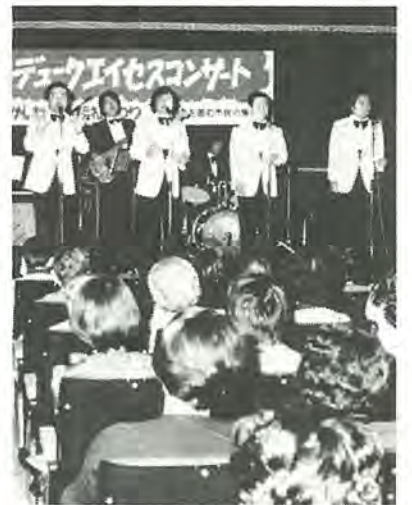
昨年の「かしわっ葉福祉まつり」の一コマ