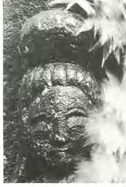
第3回ふるさとと柏写真展から 作品はカラー

柏保健所管内し尿浄化槽対策協 議会では、浄化槽でお困りのかた やこれから設置しようとするかた を対象に、街頭相談を行います。 お気軽になんでもご相談くださ い。