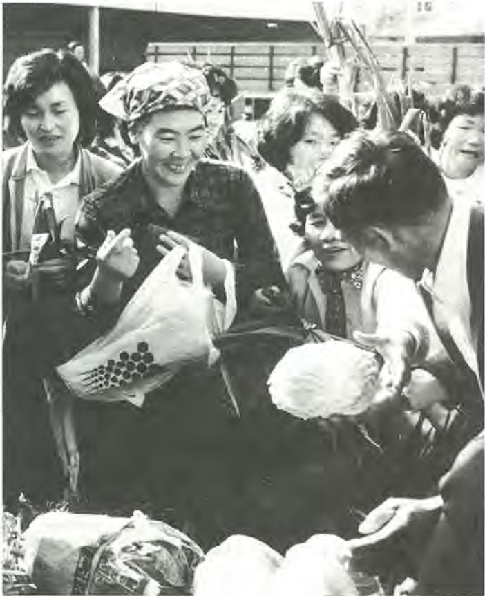
昨年は2万人が会場を訪れました(写真は富勢農協)