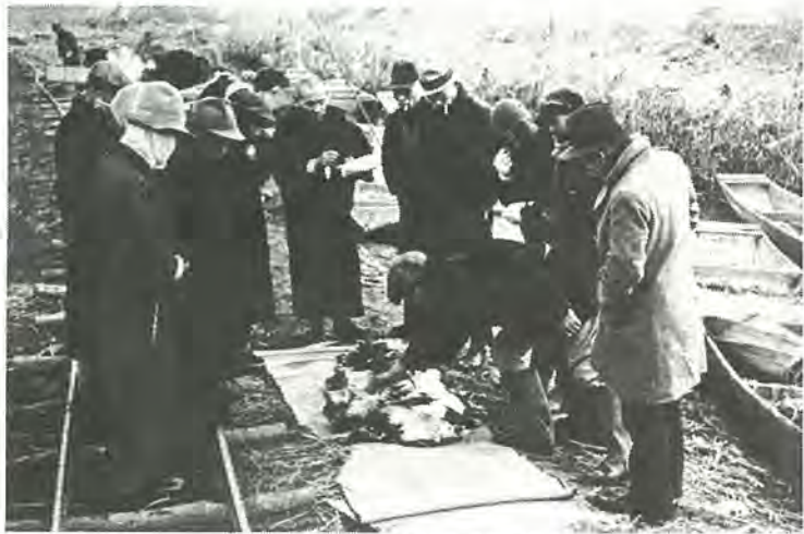
カモ猟の会所風景。仲買人が来て価格を決めました