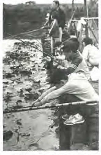
「ボクもガンバってます」

十月二十三日、田中住民つり大会が柏ヒレ水辺公園の池で行われました。田中公民館の主催で、昨年に続き一回