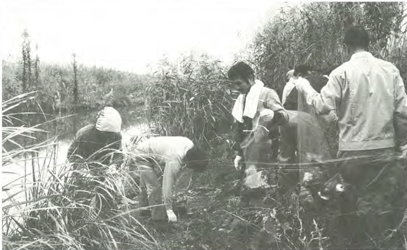
心ない人によって、川辺に捨てられた空き缶や空き瓶は意外に多いもの、手にした袋はすぐいっぱい(昨年の「ふるさとクリーン・デー」から)