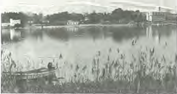
《第3回ふるさと柏写真展から》 作品はカラー