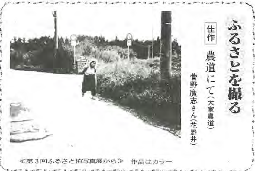
《第3回ふるさとと写真展から》 作品はカラー

○問い合わせ 健康管理課番64-133333へ。 保護者を対象に、育児相談が開かれます。保健婦、栄養士、歯科衛生士が相談に応じます。お子さんの健やかな発育のためにも、ご利用ください。 ○とき 9月7日(水) 9月7日(水) 28日(水) 旭町近隣センター ○費用 無料 ○問い合わせ 健康管理課番64-133333へ。 ○とき 9月7日、14日、21日、28日 午後6時～同9時。同20日 午後2時～同4時半。同25日 午後1時～同4時半 ○ところ 旭町近隣センター ○費用 無料 ○問い合わせ 健康管理課番64-133333へ。 ○とき 9月21日(水) 午後1時～同2時 ○持参する物 母子健康手帳 ○問い合わせ 柏保健所番67-12555へ。 ○問い合わせ 健康管理課番64-133333へ。 ○とき 9月4日(日) 午前9時～同11時半 ○ところ 柏市民体育館周辺のジョギングコース ○参加費 百円(保険料) ○用意する物 ジョギングのできる服装、タオル、運動靴 ○申し込み 当日午前9時から市民体育館前で費用を添えて直接。 ○問い合わせ 社会体育課番64-19573へ。