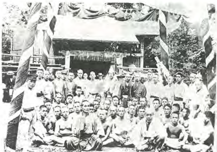
昭和初期ごろ、布施井天の境内に勢ぞろいした「力士」たち

明治に入りますと、布施井天に参拝する人が少なくなり、その振興策をかねて、十両位の力士を招いて「八朔相撲」を行なったこともありましたが、しかし、村の人たちの祭りも現在では、あとを断ってしまいました。 大相撲の世界では、ふれ太鼓の音に乗って、もうすぐ九月場所が始まります。