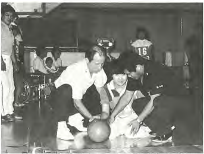
ボウリングの指導員に補助されて力投する選手

思い思いのフォームで 障害者招待ボウリング大会 障害者の皆さんの体力増強と機能回復に役立ててもらおうと、千葉県ボウリング連盟柏支部(川島栗原ボウリング連盟柏支部)の主催で、八月二十一日に心身障害者招待ボウリング大会が開かれました。今年で三回目を迎え、会場の柏ヤングボウ