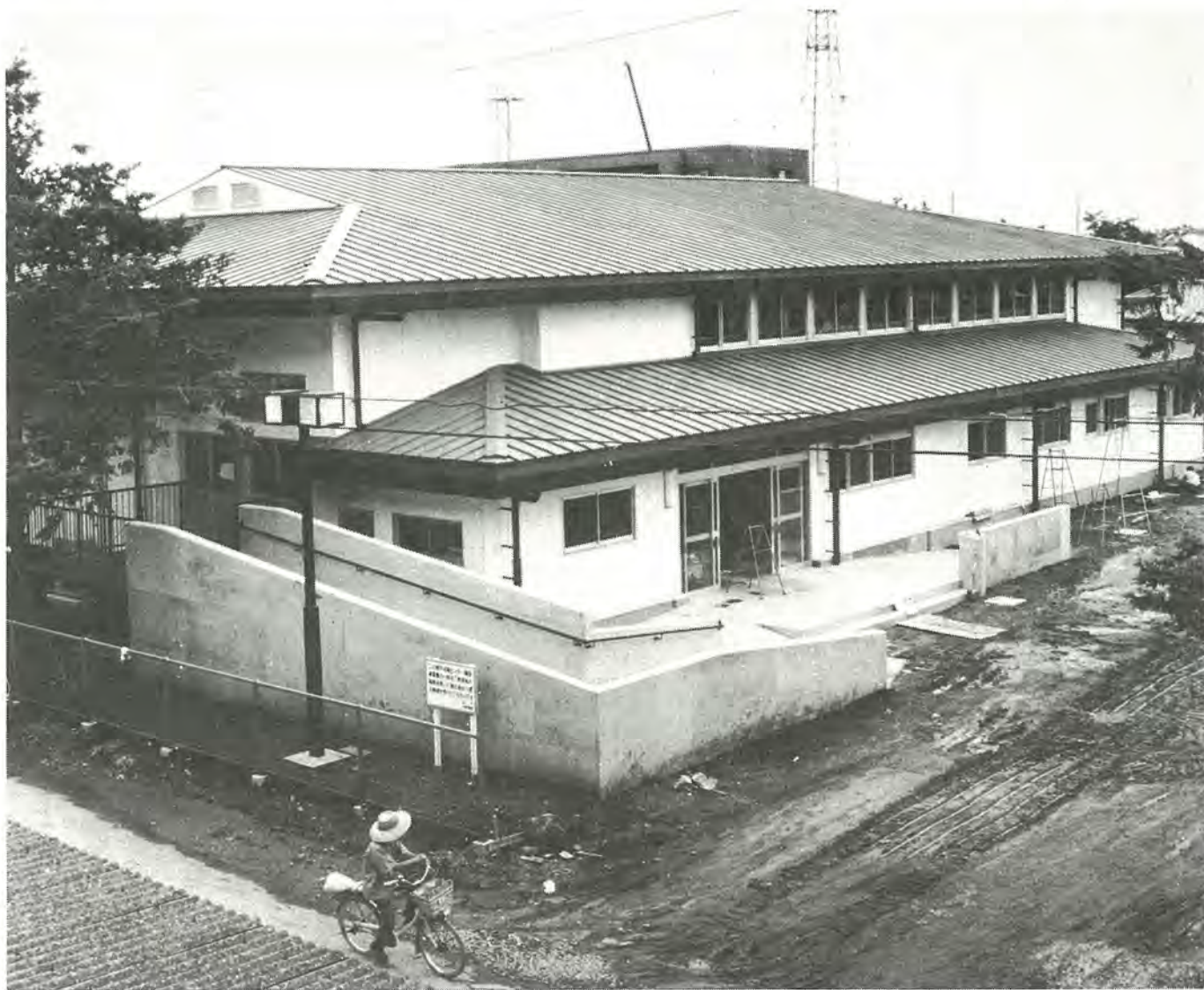
工事のほとんどが完了し、オープンを待つ根戸近隣センター—8月23日撮影