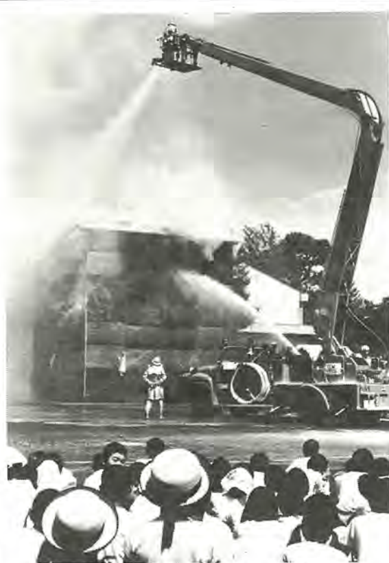
模擬建物を炎上させ、実践しながら行われる火災防衛訓練(昨年の防災訓練から)

始められ、次いで情報収集、避難誘導、救護、水道、ガス、電気、電話などの各種復旧訓練、初期消火、火災防衛訓練などが行われます。この訓練に参加するのは、自主防災組織、地元町会、柏地区医師会、柏電報電話局、東京電力、京葉ガス、柏市建設業会、柏保健所、柏警察署、市内大商店、富勢小学校、富勢中学校、消防団、消防本部、市役所など約二千人の参加が予定されています。訓練時間は、午前十時から正午までの二時間です。災害に対する心構えと日ごろの備えを再確認する訓練は、災害対策本部設置から