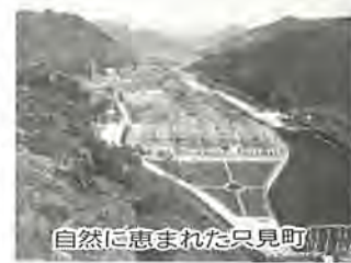
自然に恵まれた只見町

○所在地 福島県南会津郡只見町 ○交通 柏から車で約六時間 または国鉄只見線只見駅下車 ○料金(一泊二食付き) ▽旅館を利用する場合 小学生以上千五百円、三歳以下千二百五十円 ▽民宿を利用する場合 小学生以上千四百円、三歳以下千二百五十円 ○申し込みと問い合わせ 永楽台近隣センター番63-1-201、またはコミュニティ課へ。