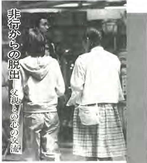
非行からの脱出 父親との心の交流

※お断り 資源品は天候にかかわらず回収日の午前7時から同日午後までにはステーションに出してください。南柏など7町会の資源回収は、都合により20日に延期。 〇問い合わせ 清掃管理課へ。