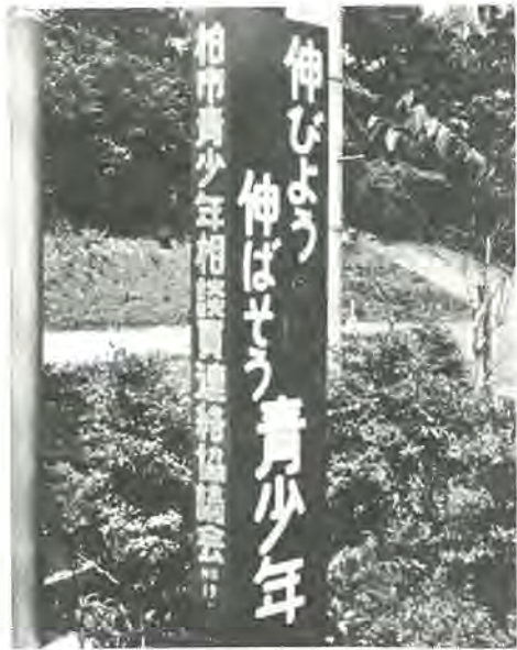
〔第3回ふるさと柏写真展から〕 作品はカラー