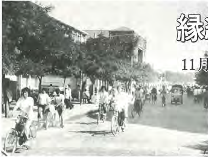
11月に友好都市になる承德市の市街地