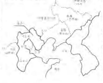
中国河北省の略図