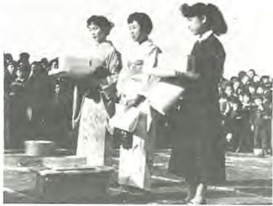
▼昨年のミス柏まつりコンテスト表彰

昭和29年、市制施行柏市で、ミス柏まつりコンテスト表彰