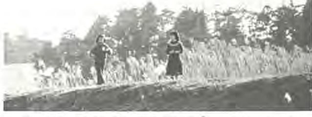
《第3回ふるさと写真真展から》 作品はカラー