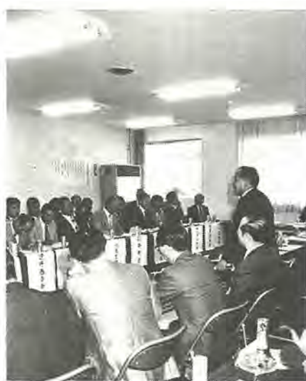
真剣に地域の問題を話し合った座談会

座談会では、道路の整備や下・排水の問題、市民プールや運動施設などについて、市の幹部職員と町会代表者がひざを交えて話し合いを行いました。