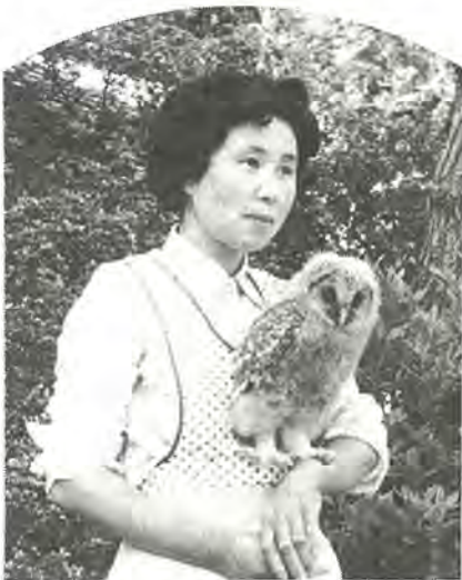
すっかり日暮さんになったフクロウのクーちゃん