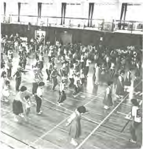
市立高校で開かれた昨年の心身障害者(児)スポーツ大会

市内の心身に障害を持つ方が、一堂に集い、スポーツを通じて相互の親睦を図る「第六回柏市中心身障者(児)スポーツ大会」が柏市民体育館で開かれます。 パン食い競争、ボール送り、フオークダンスなど障害者たれでもが参加できる楽しい競技ばかりです。数多くの参加をお待ちしております。 また、当日は、一般市民の皆さんの見学や応援も大歓迎です。ぜひご来場ください。 ○とき 6月12日(日)午前9時半から午後3時 ○ところ 柏市民体育館 ○申し込みと問い合わせ 6月6日まで、社会福祉協議会事務局 63-19001へ。