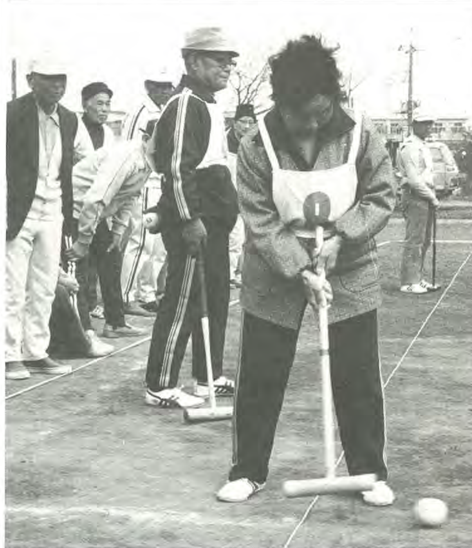
ゲートボールを楽しむお年寄りたち。国民年金は豊かな老後の設計に役立ちます。第1回柏ことぶきゲートボール大会から

年金保険料は、長い間納めるものです。その途中で生活が苦しくなったり、病気やけがなどで年金保険料を納めることができなくなることがあります。保険料を納めずそのままにしておくと、将来の老齢年金はもちろん、万一のとき障害年金や母子年金などが受けられなくなってしまう。そこで、国民年金は、こうした場合に、保険料の免除を受けることができます。免除を受けることができるのは、国民年金の強制加入者で、本人に所得がないときや、家計が苦しくて保険料を納めることができない場合です。手続きは、市役所の国民年金課窓口で、七月三十一日までに行ってください。この申請が認められると、今年の四月から来年三月までの保険料が免除されます。なお、免除を受けた期間は、もらえる年金額が三分の一となります。その後、十年以内に生活にゆとりができた時、免除を受けた額を納めれば、通常の金額で年金を受けられます。