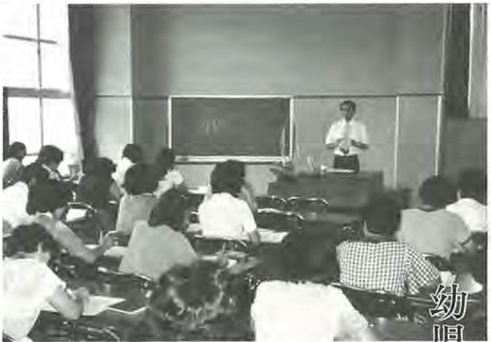
研修を受ける幼児教育モニター皆さん