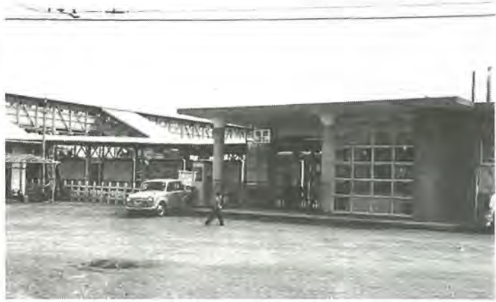
昭和31年、開設されたころの柏駅西口