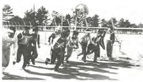
からは雨天の日以外の毎日、練習を重ねていたとのこと。

十余二の精神薄弱者授産施設・青和園(院長宗利園長、園生数三十一人)では、晴天に恵まれた二月二十二日、園生たちのランニング大会が行われました。写真。 コースは同園前の自衛隊送信所の周りを一周するもので、千五百メートルと二キロの二班に分かれて走りました。 同園では日課の中に、ランニングを採り入れているもので、一月までは一日おきに、二月に入ると