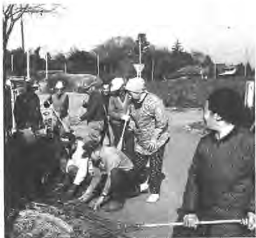
「イチ、ニ、サン」を合い言葉に掃除に励むお年寄りたち＝船戸青年館前で

市内にある百二十四の老人クラブの皆さんが、十二月一日から十日まで、市内の公園、保育園、近隣センターなどの公共施設や道路わきを大清掃しました。