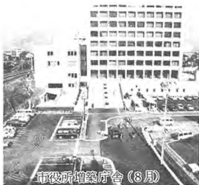
市役所増築庁舎(8月)