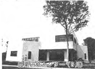
農業研修センター(5月)