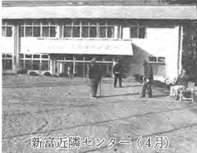
新富近隣センター(4月)