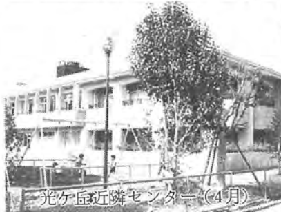
光ヶ丘近隣センター(4月)