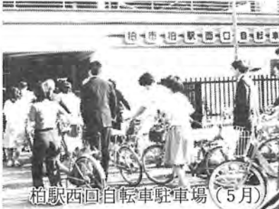
柏駅西口自転車駐車場(5月)