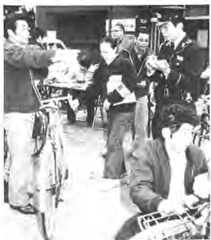
受付に順番待ちの列が出来るほど盛況だった自転車の防犯登録＝梅林青年館前で

これは、同支部が今年四月に「防犯モデル地区」の指定を受け、この防犯活動の一つとして実施したもので、自転車の防犯登録は販売店などが登録依頼を受け、自転車の防犯ステッカーを付けると同時に自転車登録票に所有者の住所、氏名、自転車の種類などを記入して警察に提出。もし、自転車が盗難に遭いばかの場所で発見された