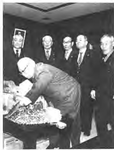
集められた1円玉の山に鈴木市長(右)もびっくり

市内百二十四クラブが加盟する老人クラブ連合会では「使われずに眠っている1円玉を有意義に」と、十一月十日から一月間、一円玉募金をしました。これは、今年が初めての試みで、老人クラブが、市役所に鈴木市長を訪ね、社