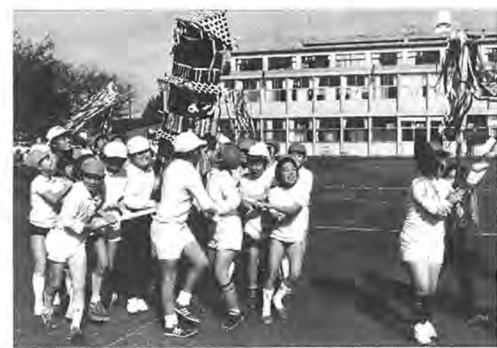
校庭を練り歩く、4年生の三重の塔みこし。「ワッショイ、ワッショイ」と元気いっぱいの子供たち

おみこしのおと校庭は青空おもちや市に早変わり。店頭には割りばしで作った輪ゴム鉄砲、ビニール製のたこ、紙コップを利用したけん玉など学年ごとに作ったおもちやが並べられ、交