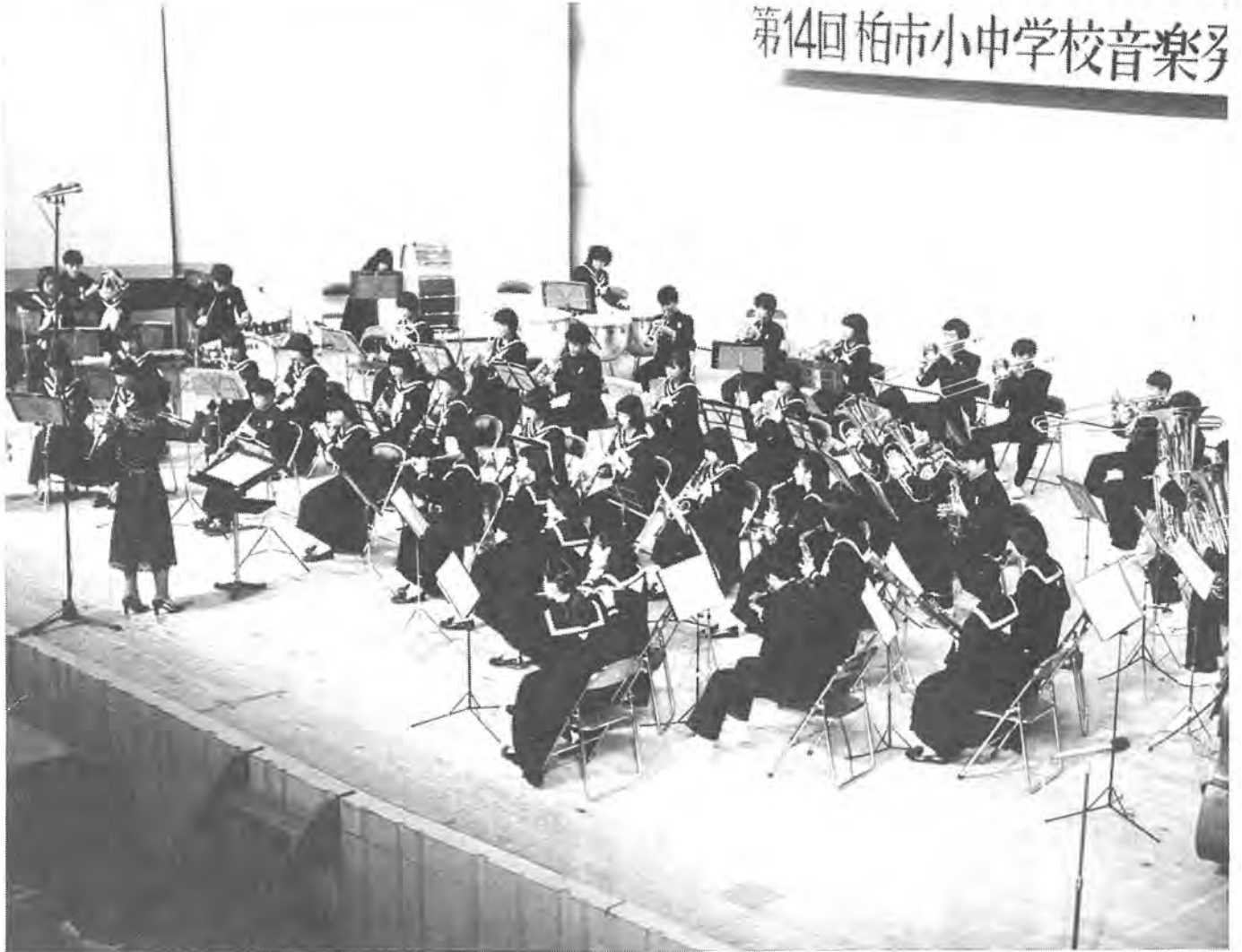
市内でも最大のものと言えるこの音楽会。回を重ねるごとにそのレベルも上がっています =柏四中の吹奏楽、21日、市民文化会館で