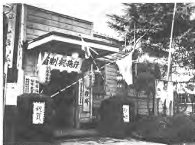
柏市制を祝う市庁舎

昭和二十九年九月、田中村、柏町、土村、小金町の四力町村が合併して東葛市を称し、小金地区や富勢地区の廃置、分合を経て、同年十一月、柏市に名称を変更しました。