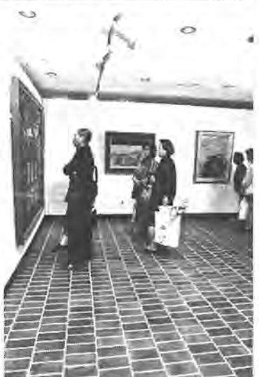
郷土の作品を中心に展示されている移動美術館