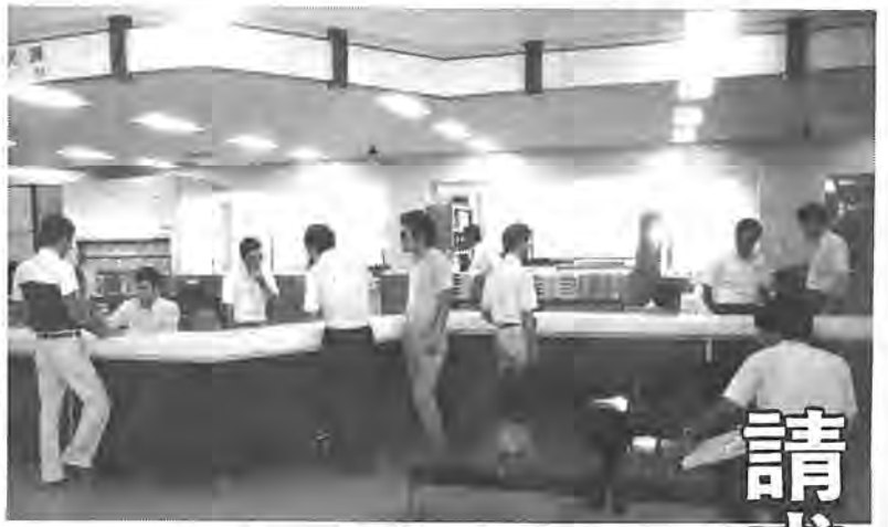
住民票の写しなどは市民課、出張所を合わせて一日四百件以上の申請が