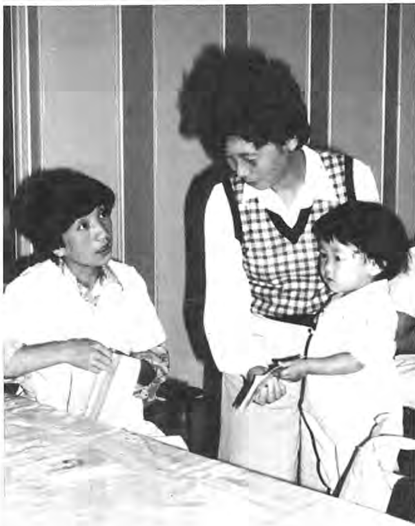
1歳6カ月児健康診査の受診を呼びかけることも保健推進員の大切な仕事です