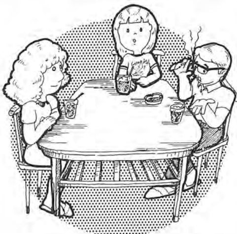
テーブルを囲んで親子で反省会しては…

楽しかった夏休みも終わり、いよいよ今日から二学期。小・中学生の皆さんは、どのような夏休みを過ごされたでしょうか。二学期は、体育祭・文化祭など皆さんの行事がめじろ押し。そこで、早く夏休みの生活リズムから、規則正しい生活リズムへ戻すために、親子でしっかりとけじめをつけてから、新学期のスタートを切りましょう。