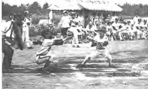
初めての交歓試合で緊迫したゲームが展開されました

三郎部長、二十五チームが姉妹 野球連盟の緑組みをしたのをきつ かけに行われたもの。第一回目の 今回は、桐生市から天沼、昭和メ ツの二チームが訪れ、柏市夏季 大会のベスト4高野台ジャガー ズ、リヤノス、 トライスター、 新栄町と対戦。 白熱したゲーム が繰り広げられ ましたが成績は 柏市の一勝三敗 となりました。