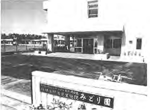
我孫子市内に建てられたみどり園

柏、流山、我孫子、沼南の三 市一町で構成する東葛中部地 区総合開発事務組合が設立した 精神薄弱者更生施設「みどり園」 では、構成市町の皆さんから園 章と園歌を募集します。明るい 希望に満ちた園のため、皆さん の応募をお待ちしています。