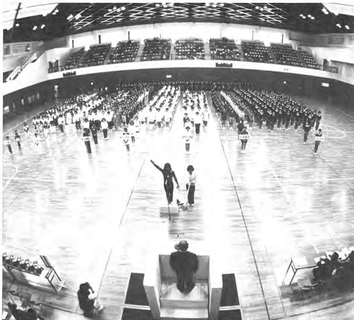
年々盛り上がるこのスポーツ大会、今年も9日間にわたって熱戦が繰り広げられます。参加者からは「よその地域のかたとの交流もできて、楽しいわ」(写真は昨年の開会式)