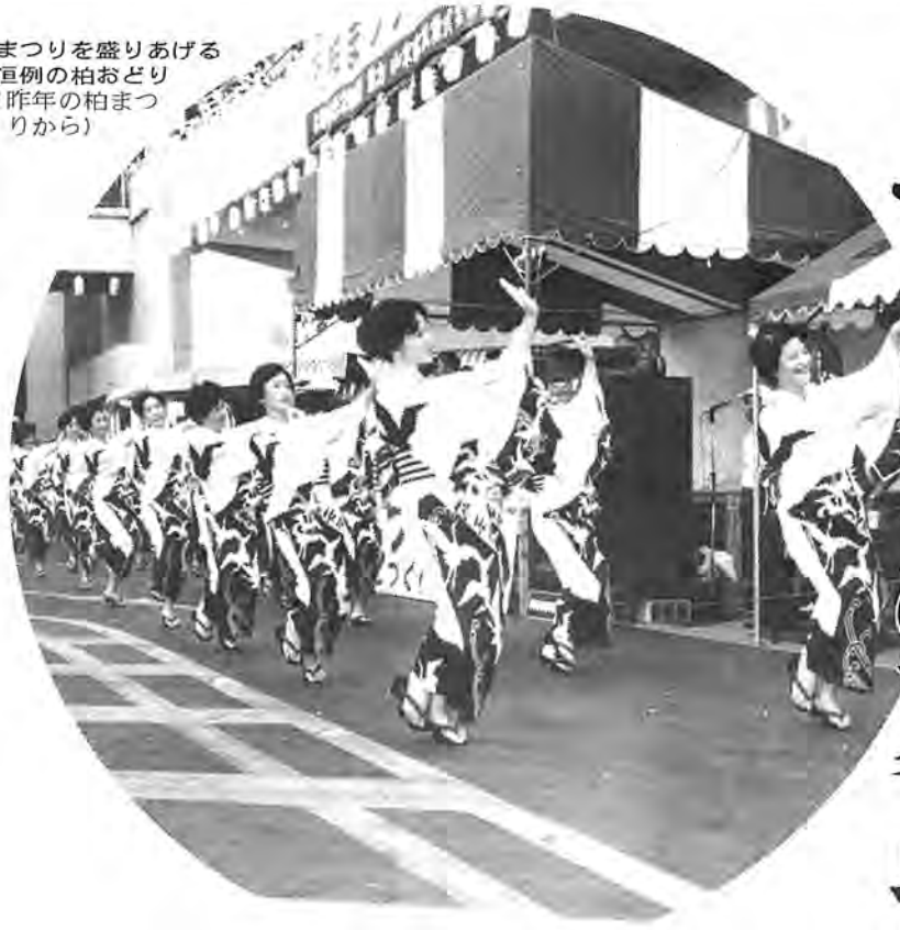
まつりを盛りあげる 恒例の柏おどり (昨年の柏まつ りから)