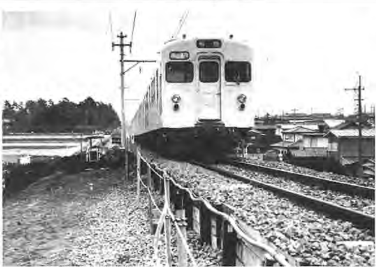
本格的な工事が始まった新駅付近。線路の左側が区画整理区域、右側の住宅地がつくしが丘(昭和57年3月撮影)

建設と同じ手順で進められ、新しい線路には電車による振動や騒音を少なくするため、レールとレールの継ぎ目の少ないロングレールが使用されるほか、枕木も木製のものをコンクリート製の枕木に