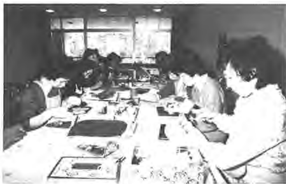
木づちを持つ手も軽やかな「みもぎ」の皆さん