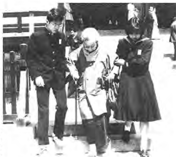
「おばあちゃん、ゆっくりネ」—成田山新勝寺で

桜の花もほろびはじめた三月二十九日、「愛の文通」で結ばれた小中学生・高校生とお年寄りがそろって成田山新勝寺にお参りしました。