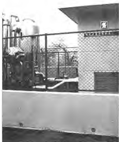
田中中に設置された耐震性の飲料水供給装置

地震などの災害時に断水が起きることを想定して、市では飲み水を確保する耐震性の非常用飲料水供給装置を、田中中学校の校庭に設置しました。