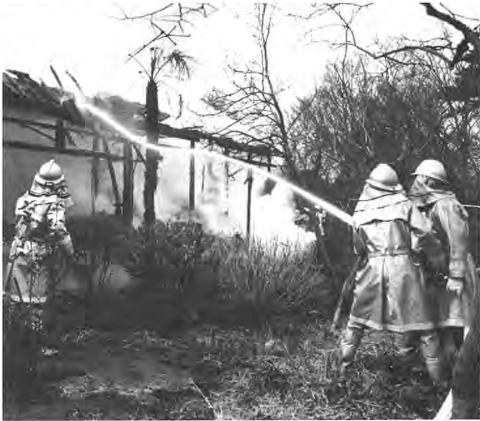
火災は、私達のちょっとした心がけしだい防げるものがほとんどです

恐ろしい火災は、いつ起こるかわかりません。柏市内では、今年に入ってから二月十二日現在、すでに二十三件の火災が発生し、二人もの尊い人命と貴重な財産が失われています。