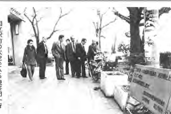
国立駅前状況を視察する一行

柏市役所では、現在、庁舎の増築工事をしています。このため、駐車場は図の2カ所しかなく、しかもたいへん狭くなっています。税の申告などで来庁される場合、車のご利用はご遠慮されるよう、皆さまのご協力をお願いします。