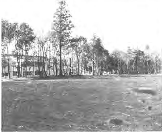
3万平方メートルの大規模な公園がつくれる南部近隣センター周辺

市内南部地区に大規模な公園、南部公園が建設されることになり、現在、その造成工事が行われています。 ある広場を中心に周辺の山林一帯、総面積は、昨年完成した二万六千平方メートルの増尾城址公園よりも広い約三万平方メートル、布施弁天近く