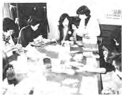
「細かい作業だけど楽しいわ」

二月九日、豊四季台婦人児童センターで「つまみ絵」の講習会が開かれ、参加した十八人の主婦は、もう一つ新しい趣味を増やしました。 今回行われたつまみ絵は、約三、四時間の布きれをピンセットを使って折り曲げ、これを一枚一枚バ