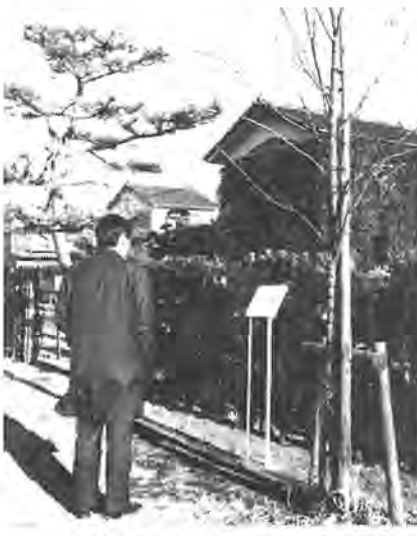
生けがき見本のある千代田町公園

利子補給を伴う融資の対象額は、十万円から五十万円までで、利子は金額市が負担します。なお、利子補給期間は五年以内です。 生けがきをつくる場合は、植栽位置や樹木の基準がありますので詳しくは公園緑地課(番63111-14)へお問い合わせください。 なお、生けがきの見本が千代田町公園内に設置されています。(一)参考にどうぞ。