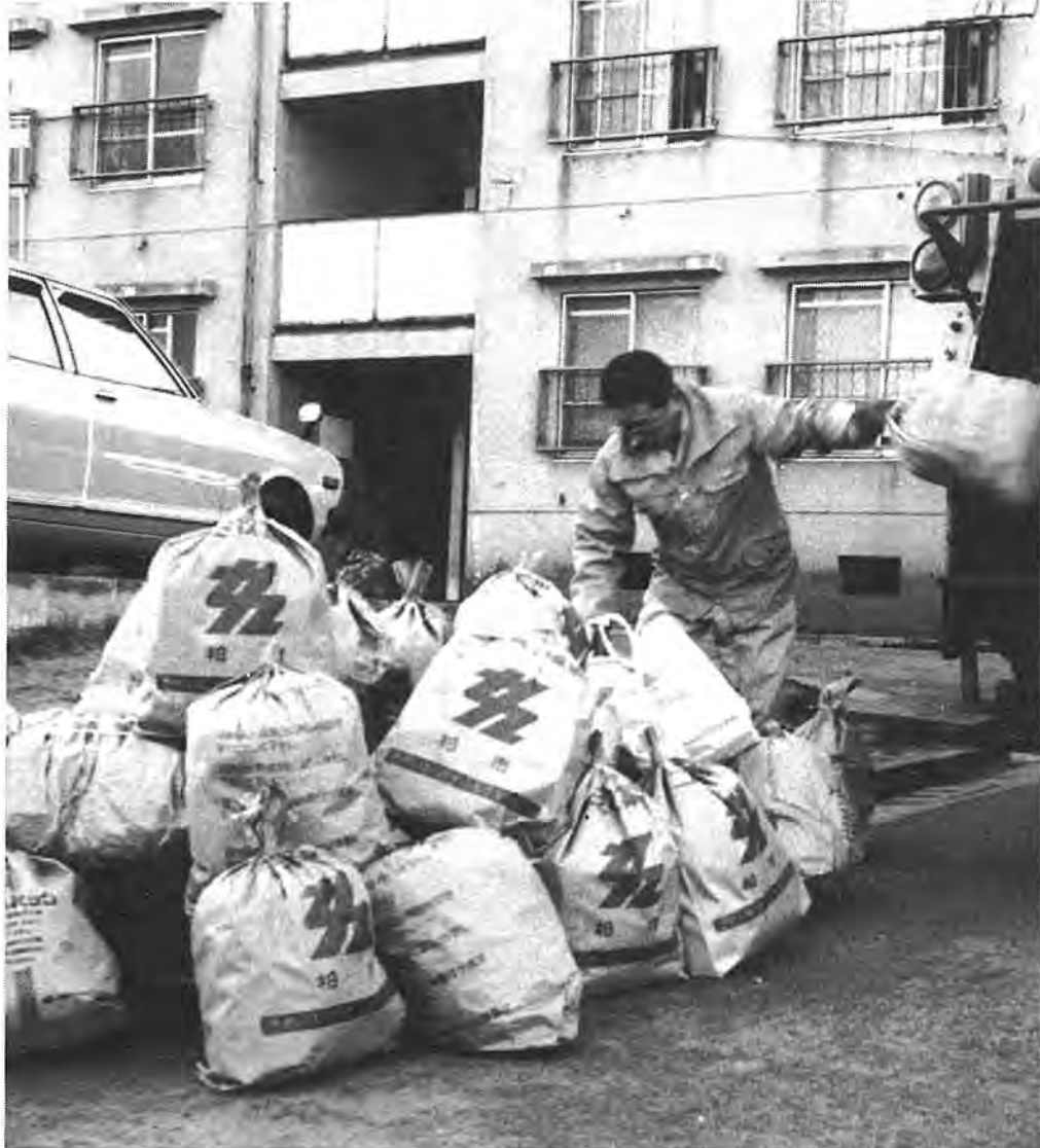
分別され市指定の紙袋できちんと出されたゴミ＝1月19日、向原町会で