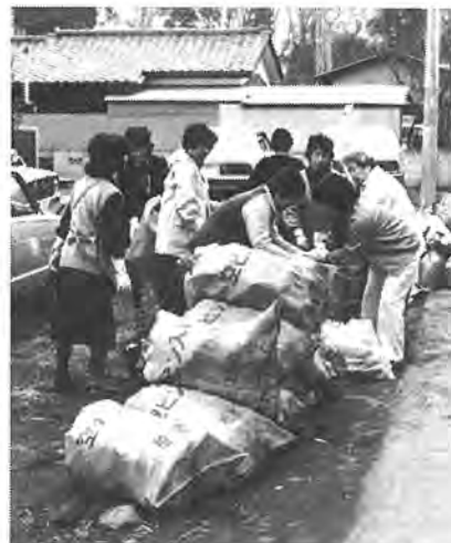
空き缶、空き瓶はこのように資源ゴミ回収モデル地区の柏楽園町会で