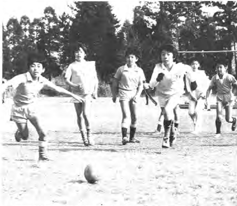
伸び伸びとボールを追う子供たち=1月24日、十余二青少年広場で行われた少年サッカー大会から

非行の低年齢化、一般化が進んでいるといわれる中で、青少年の健全な育成がいまや社会の重要な課題となっており、これらを解決するためには、家庭が、学校が、そして地域社会が一体となって取り組んでいかなければなりません。特にこれからの時期は、卒業、進学、就職など青少年にとって大事な節目であると同時に、最も心の揺れ動くときでもあります。そして、毎年非行が最も多発するものこのころといわれています。そこで市では、より多くの市民の参加と責任で、青少年のおかれている実態をより深くみつめ、非行化防止と健全な成長を目指して、二月一日から二十八日まで一月間を「青少年健全育成推進強調月間」と定めました。この期間中は、青少年のすこやかな成長を願って、をスローガンに掲げ、青少年健全育成関係団体を中心に各地域で様々な活動が展開されることになっています。市民の皆さん、この運動をともに考え、行動し、協力しあう市民総ぐるみの運動にするためにぜひ参加してください。