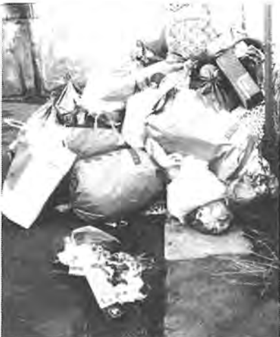
一部には残飯が散らかっているところも

最近では、子供部屋のくすかこの中まで全部点検して出すほどななです。これは要望なんですけど、市指定のゴミ袋は大きすぎますね。これの半分ぐらいのも用意してくれないかしら。あまりゴミを出さない人もいますし、特に、台所ゴミは冬の間は腐りにくいのでためておくこともできるんですけど、夏のことを考えると小さな袋でそのつと出したほうがいいと思いますね。でも、多少手間はかかってもゴミはきちんと分別して出すことが大切だと思います」とお話ししてくれました。