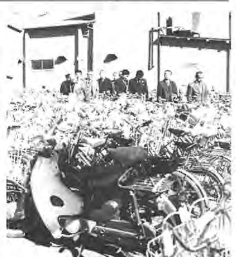
放置自転車問題の解決はまず実態をは握することから

一月二十日、柏市教育福祉会館で、昨年十二月十三日に発足した、「柏市放置自転車等対策協議会」の、第二回目の会議が開かれました。 近年、通勤、通学などに使われる自転車が駅周辺にあふれ、自転車、公道として、大きな社会問題となつていきました。市では、この問題を解消するため、自転車駐車場の整備をはじめ、多くの対策を講じてまいりました。しかし、まだ駅(東・西口)周辺に放置されている自転車の多くは、多くの自転車が放置されています。 そこで、どのようにしたらこの問題を解消できるか、その対応策を総合的な見地から考え、協議していかうというのが、同協議会発足の趣旨です。そのため、同協議会のメンバーは、市議会議員、自転車利用者、行政・交通機関の関係者、商店街、大型店等各種団体を代表されるかたなど、二十五人(別表)で構成されています。同協議会としての当面の課題は、柏駅(東・西口)周辺に放置されている自転車の、具体的な解消策を協議していかうことです。