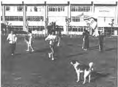
自分であげても、自分であげても、校庭で遊ぶのが楽しくて、犬も喜んで

「なかなかうまくあげられない」とは、田中北小学校(柴山)校長、児童数六百七十七人で、十二月二日に行われた、タコあげの一場面です。これは、児童が互いに協力し合っ