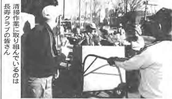
清掃作業に取り組んでいるのは長寿クラブの皆さん

私たちの住む柏市を、きれいで住みやすい環境の街にするために、クリーン作戦をはじめ、清掃活動の輪が広がっています。しかし、なによりもみんなのゴミや空き缶を捨てないよ心がけが、最も大切なことではないでしょうか。