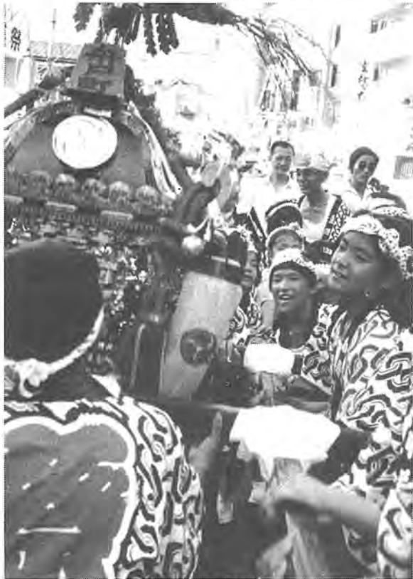
「ふれあうよろこびみんながつどう」をスローガンに開かれた柏まつり。8月1、2日の両日延べ33万人が繰り出し、多くのイベントでふるさと柏のエネルギーを爆発させました。