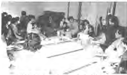
町会でのゴミの出し方説明会

市役所土出張所、それに、同出張所内にある土公民館が、今年四月に開館した増尾近隣センター内に移転し、来年一月から業務を開始する予定です。開会中の十二月定例会で審議されています。また、その際の各施設の名称も、土