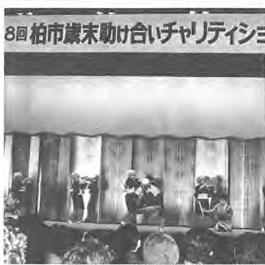
日ごろの練習の成果を披露。場内からは「よ、いいぞ！」の声も聞かれます

毎年、この時期の恒例行事として「チャリティショー」が、十二月六日に行われている「歳末助けあいチャリティ」に市民文化会館の大ホールで盛大