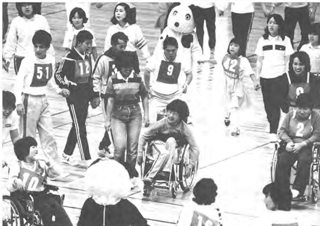
184人の選手が参加し、思いっきり体を動かした心身障害者(児)スポーツ大会。ボランティアサークルなどの温かい協力がありました。 = 6月21日、柏市民体育館で

わたしたちは、豊かな緑と水を守り、潤いのある住みよい柏をつくるために、この憲章を定めます。 1. たがいに話し合っ、心のかよう明るい柏をつくりましょう。 1. 老人を敬い子どもを愛する、あたたかい柏をつくりましょう。 1. 環境をととのえ、安全できれいなまち・柏をつくりましょう。 1. 教育を重んじ、健康で、文化の薫り高い柏をつくりましょう。 1. 国際理解を深め、平和な柏をつくりましょう。