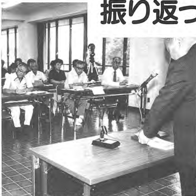
市民参加の行政をより発展させることをねらいに開かれた柏市民自治大学。市民50人が柏市の歴史、現状、将来や問題点を学びました。