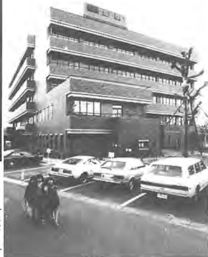
生涯教育と福祉の複合施設としてオープンした柏市教育福祉会館。4月25日から30日まで、多彩な記念行事が催され、若者やお年寄りが集いました。