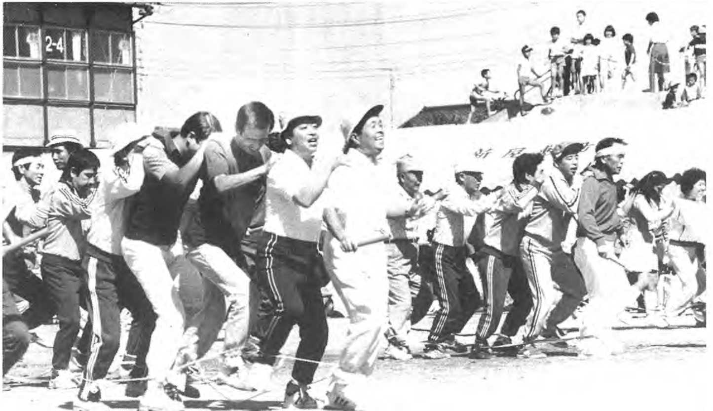
〔富勢地区市民運動会〕競技種目のひとつ、むかで競走では、足がもつれてあちらこちらでころぶ光景も