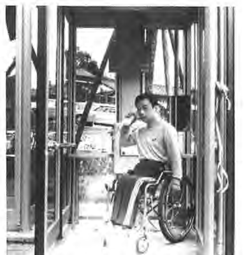
柏市で初めて設置された車イス用電話ボックス

車イスの方でも楽に利用することが出来る車イス用公衆電話ボックス二台が柏市で初めて設置され、十月七日、その開通式が行われました。これは、柏電報電話局が、教育福祉会館一階入口と、同会館三階の中央公民館入口の二カ所に設置された。これは、柏電報電話局が、教育福祉会館一階入口と、同会館三階の中央公民館入口の二カ所に設置された。これは、柏電報電話局が、教育福祉会館一階入口と、同会館三階の中央公民館入口の二カ所に設置された。