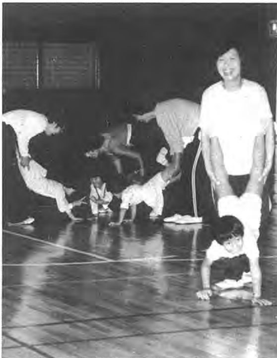
〔親子体操〕子供のころから体操好きに。親子の触れ合いも一層深まります

十月十日は「体育の日」。この日は、スポーツの秋にふさわしく市内の各地域で、歩こう会や体力テスト会、運動会など数多くの催しが行われました。現代は、機械化や省力化によって、体を動かす機会が少なくなっています。また、週休二日制などで余暇が増え、これに伴って余暇を有意義に過ごすよう、健康増進に仲間同士の親ばく融和に、スポーツをはじめ市民が増えています。体は使わないとどんどん退化してしまうといえます。今号では、「体育の日」の催しをカメラの目を通して見てみました。秋はスポーツに絶好の季節です。ぜひ、あなたも健康づくりにスポーツをはじめてみませんか。