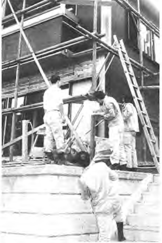
工事現場を立ち入り調査する職員

来年四月に入園する保育園児の入園申請の受け付けを開始します。申請される方は、申請用紙交付期間内に入園を希望する保育園で申請用紙を受け取り、その時に指定する受け付け日に提出するように入園申請の受付を開始します。申請される方は、申請用紙交付期間内に入園を希望する保育園で申請用紙を受け取り、その時に指定する受け付け日に提出するように入園申請の受付を開始します。