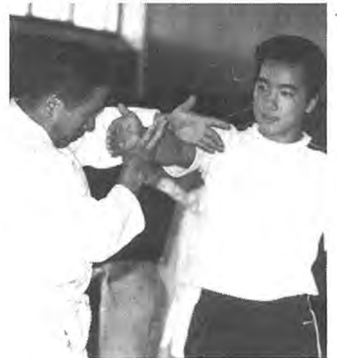
〔合気道〕健康増進に合気道をされるかたが増えました

十月十日は「体育の日」。この日は、スポーツの秋にふさわしく市内の各地域で、歩こう会や体力テスト会、運動会など数多くの催しが行われました。現代は、機械化や省力化によって、体を動かす機会が少なくなっています。また、週休二日制などで余暇が増え、これに伴って余暇を有意義に過ごすよう、健康増進に仲間同士の親ばく融和に、スポーツをはじめ市民が増えています。体は使わないとどんどん退化してしまうといえます。今号では、「体育の日」の催しをカメラの目を通して見てみました。秋はスポーツに絶好の季節です。ぜひ、あなたも健康づくりにスポーツをはじめてみませんか。