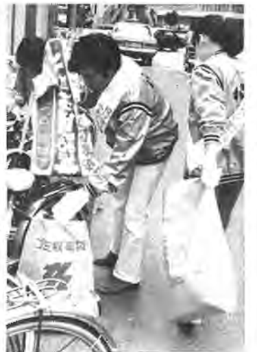
233人の人たちが参加して道ばたのゴミを回収

周年を記念して試みられた第一回目の奉仕活動で、参加したのは商店長や社員ら二百三十三人。「心」というシンボルマーク入りのユニホーム姿をした全員が、十人ずつチームを組んで、柏駅を中心に四キロ圏内の国道や県道、路地裏にくり出し、ちがったゴミを拾い集めました。この日約三時間で回収されたゴミの量は、十二トン強。なかでもポイ捨てのあきカンが全体の八割を占めていました。一方、柏駅構内では、ゴミ袋三万二千枚を通行人に配布し、投げ捨ての掃を訴えました。