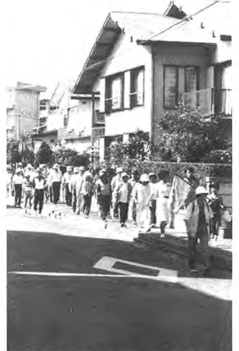
〔歩こう会〕青空の下、子供からお年寄りまで仲良く行進