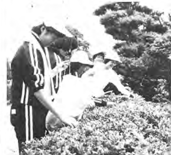
お茶をつむ手にはぎこちなさがあっても、収穫の喜びにわく田中中の生徒たち

少なくなつてきていますが、同校のある田中地区では、また農地も多く畑と道路の境や農家の生けがき、昔からのお茶の木が多く残されています。そこで同校が「生徒たちに茶つみを通して先生や地域の人々との触れ合いを深め、働く尊さを体験させる」ことを目的に始めたもので、今回が二十四回目。