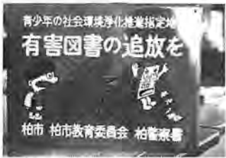
追放運動の看板 …市内500カ所に

最近、市内のどこにでも、雑誌の自動販売機が置かれています。その中には、一般の週刊誌ばかりではなく、ポルノ雑誌類が販売されており、年ごろの子どものもつ家庭から「なんとかならないものか」という声が寄せられています。