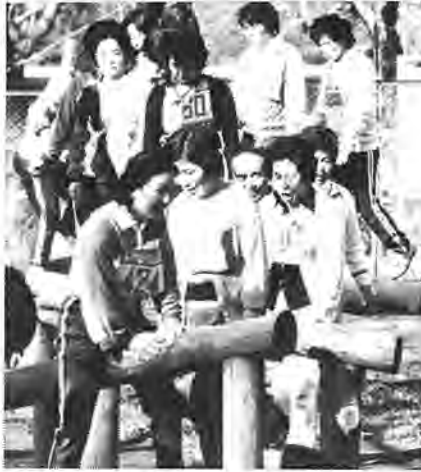
昨年健康増進事業のトレーニングからあけぼの山公園フィールドアスレチックコースで

同事業は、まず初めに医学的検査や体力測定を行って健康度をチェック。そして個人の健康度に応じて提示された生活プログラムをもとにトレーニングを進むというもので、今回は五月下旬の講演会に始まり、九月からトレーニングを開始。十二月にその効果測定をする予定となっています。 ○対象 三十一～六十四歳までの