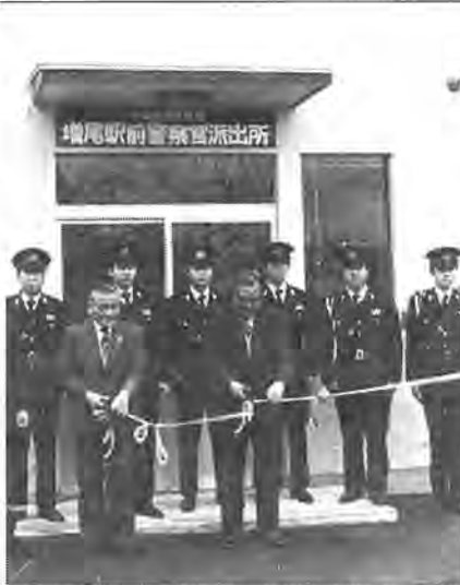
6人の新任警官を前に開所のテープを切る松野署長と柏市長(写真左)

は、経済四十五人、歴史二十四人が在学。年々応募者が増え、昨年は定員の五倍を超える倍率を示しました。このため新年度では、教育福祉会館内の中央公民館に移るにともない、そのワクを広げたいとしています。