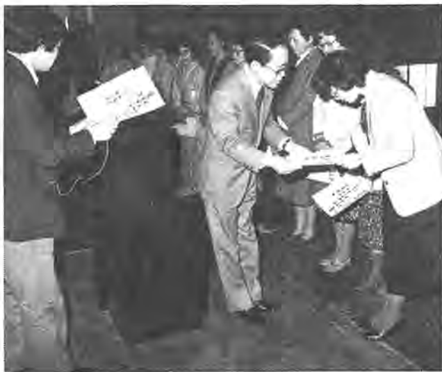
緊張気味に証書を受け取る卒業生たち

柏公民館が、昭和五十三年度から開いている婦人大学二期生の卒業式が三月十三日、同館ホールで、十三人、法律科十八人の三十一人。