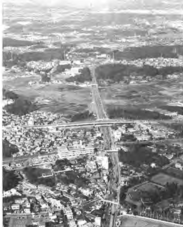
生活環境の整備と調和のとれたまちづくりから「ふるさと柏」が創造されます

昭和五十六年第一回定例会市議会が、三月六日から二十五日までの日程で開かれています。この議会では、昭和五十五年次を目標とした基本構想の策定、柏市職員定数改定、特定行政庁移行に伴う建築審査会の設置、公共下水道事業に係る受益者負担金制度、浄化槽を撤去して公共下水道に接続する場合の貸付金制度などに関する条例の制定・改正など四十三議案が審議されています。この中で、ふるさとづくりを根幹とした生活関連施設の整備促進と、国際障害者年関連事業を主とした昭和五十六年度予算案(一般会計計三億七千九百九十九万九千九百九十九円、水道事業を含まない特別会計計三億三千四百三十三万九千九百九十九円)も審議されています。今号では、この三月議会に提案された議案のうち主なものを紹介します。