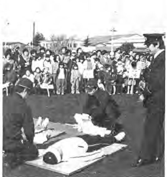
消火器や三角バケツの扱い方、地震体験など盛りだくさん。約三時間にはわたる充実した訓練もあつた。

二月二十日、「地域の防災は地域の住民で」と、今年二月一日に発足した自主防災組織「梅林町会防災会」で、初の防災訓練が行われました。