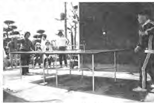
まだ若いもんには負けられん。結構きまってるでしょう

このクラブは、あかね町に住むお年寄りが集まって、昭和五十四年七月に結成したもので、メンバーの九人全員、卓球するのは初めてだったといふ。