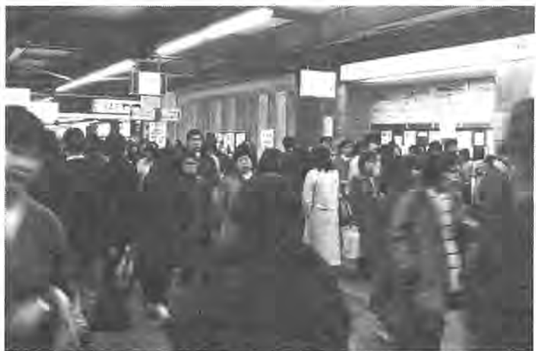
3月には装いも新たに、駅東西口の通行も緩和に向かう国鉄柏駅出口口付近

柏駅の自由通路は国鉄部分と東武部分を合わせて延長九十五、幅員は十、昭和四十六年、常磐線が複々線化されるに併せて現在の橋上駅になった時の設計です。当時、一日平均の乗降客数は東武柏駅を合わせ十七万人程度であったものが、その後の通勤客数の急増や、駅前再開発に伴う大型店の出店によって買い物客による駅利