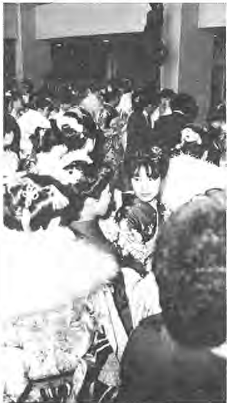
社会への旅立ちを祝福し合う20歳たち

一月十五日、柏市民文化会館で一新成人を祝う式典が催されました。今年、大人の仲間入りした