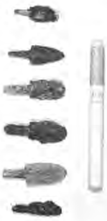
市民に公開される六つの矢じり(銅ぞく)

先土器時代から奈良・平安期に至るまで、市内から出土した石器や土器を中心に展示する「古代の暮らし—柏のむかし展」が、八月二十一日から柏市民サロンで開かれます。 展示は、先土器、縄文、弥生、古墳から奈良・平安の五つの時代に分け、私たちの祖先たちの暮らし向きを示す出土品六十点が並べられます。 この中には、昨年十一月から今年四月まで発掘調査された戸張一番割遺跡から出土した銅製の矢じり(銅ぞく)六本と同じ銅製の鏡重文鏡が市民に初めて公開。 このほか、各時代を特徴づける土器やハニワなどに加え、住居跡の図解パネル、写真なども組み合わせて、小中学生に歴史の流れがわかりやすいよう工夫されています。当時の暮らしを一目で見られるミニ模型、ジオラマも用意されるこのむかし展。夏休みのお子さんごいっしょに柏の歴史を学