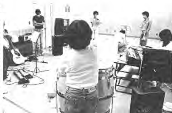
二人の女性メンバーが、ジャズ演奏を必要とする

ドラム、コンガのリズム、シンセサイザーのハーモニーに乗ってギター、トランペット、トロンボーンが奏でる軽快なメロディー。 結成してまもない「柏ジャズクラブ」は、来月五月に柏市民文化会館で開くコンサートに向けて練習に熱がこもる。練習場所は豊四季台近隣センターの青少年ホール。メンバーは全部で十一人。四人が学生のほかは、建築、土建、歯科技工士などの職業を持つ。平均年齢二十二歳。そのほとんどが高校時代からアラスバンドなどの楽器経験者で、初めころは吹奏楽の練習をしていた。が、もっとリズムカルな軽音楽をやりたいと、ポピュラーナンバーを主と