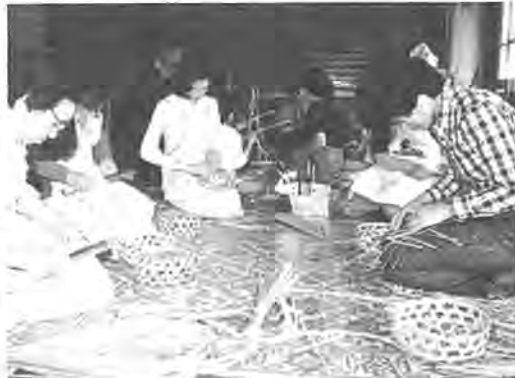
竹カゴ作りを楽しんだ春の教室

九月から作り方の教室 昔の人の生活の知恵を学ぶふるさと講座。その一つ、この春好評だった竹細工教室が九月から新たに始まります。 竹の性格を知るための材料作りから竹カゴを完成させるまでの実習の中で、民具として使われ続けた竹製品の温かみを感じられるのでは。初歩的なカゴ作りですので、お気軽に参加して下さい。 〇とき 九月七日(十月十二日の各日曜日(六回)) 午後一時~同五時 〇ところ 豊四季台近隣センター 〇対象 中学生以上で市内在住の方 〇定員 先着二十五人 〇費用 材料費二百円 〇用意するもの ひざかけ、座ぶとんのほか作業に適した服装で 〇申し込みと問い合わせ 九月一日(月)までに社会教育課(電話63-4457)へ電話か直接おいでを。