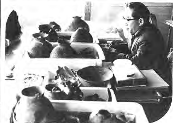
戸張遺跡の出土品を鑑定する明治大の大塚教授 —今年一月撮影