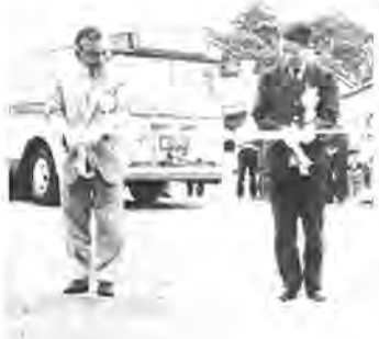
テーブルカッターをする市長(左)と東武バス柏営業所長

七月一日、午前六時八分。これは新しく完成した酒井根バス回線が発車した記念すべき時刻です。従来、酒井根周辺はバスの便が少なく、南柏駅への直通路線もな いといった地域で、地元住民からは、バス路線を延長してほしいと願