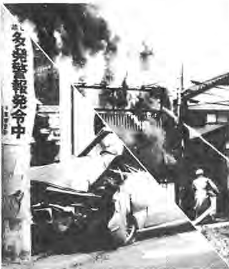
恐ろしい交通事故や火災に備えて

市では、市民の皆さんの交通事... 故や火災など、万一の災害に備え「市民交通傷害保険」と「火災共済」の制度を設けています。