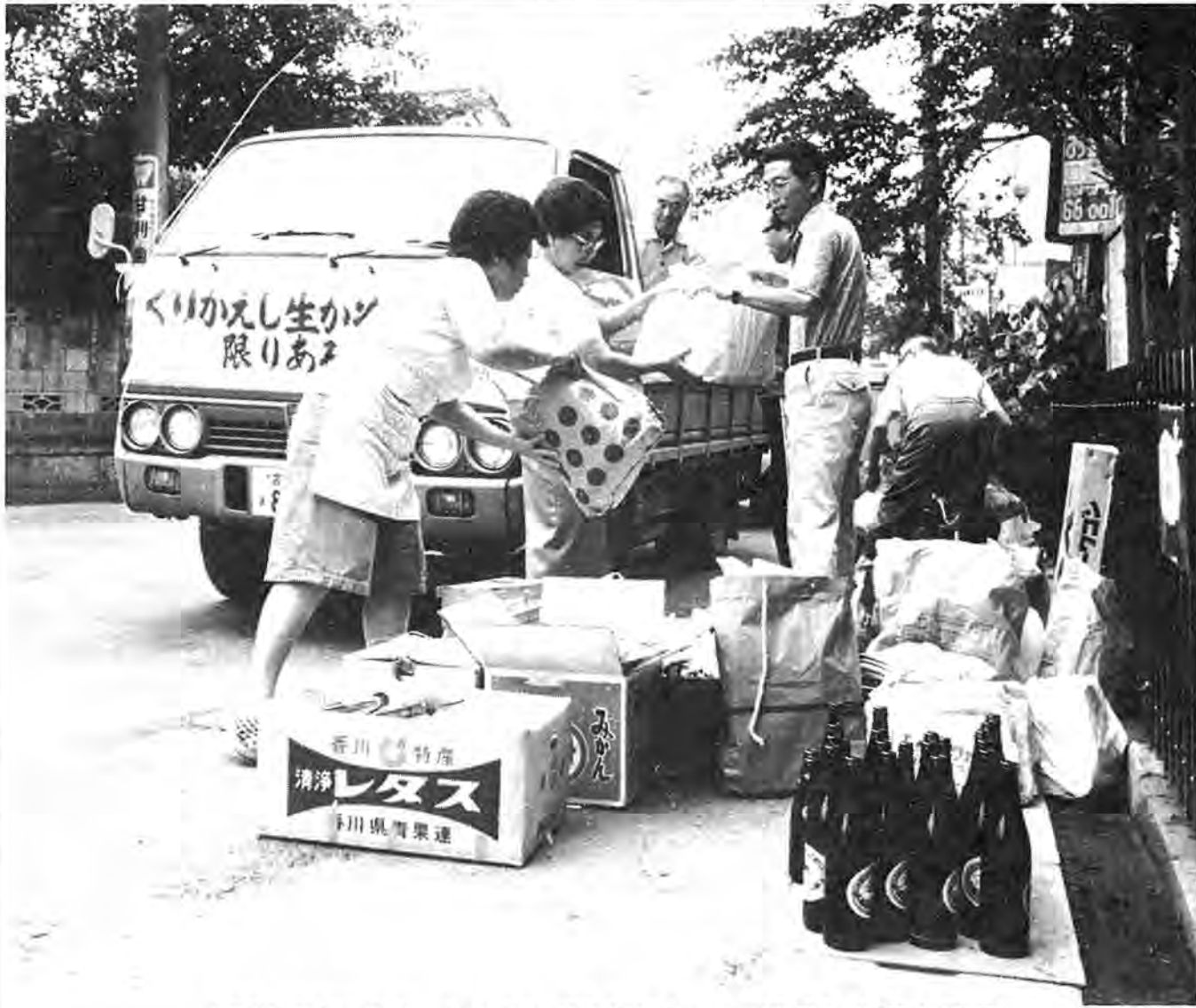
千代田町会では、町会、老人クラブ、親子会が一丸となって資源ゴミを回収している

発行 / 柏市役所(〒277 千葉県柏市柏5-10-1) ☎0471-67-1111 編集 / 企画調整部広報課 発行日 / 毎月1日・11日・21日