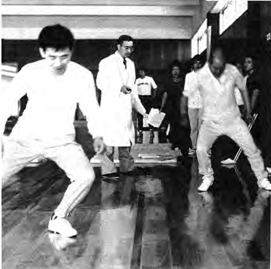
運動能力は10歳前後若返ったというデータも=反復横とび

自分の健康状態を知ったうえで、体に合った運動をし、健康を保持、増進しようというのが、中高年層を対象にした「健康増進事業」。柏市では柏地区医師会、千葉県予防衛生協会、順天堂大学運動生理学の専門家の協力で、昭和五十三年度から行っており、前回、全過程をがんばり通した皆さんは「十歳前後若返った」というデータも出ています。市では今年度も五百人の受講生を募集することになりました。料金は一人四千元。より健康な生活を求めるあなた、この機会に参加してみませんか。