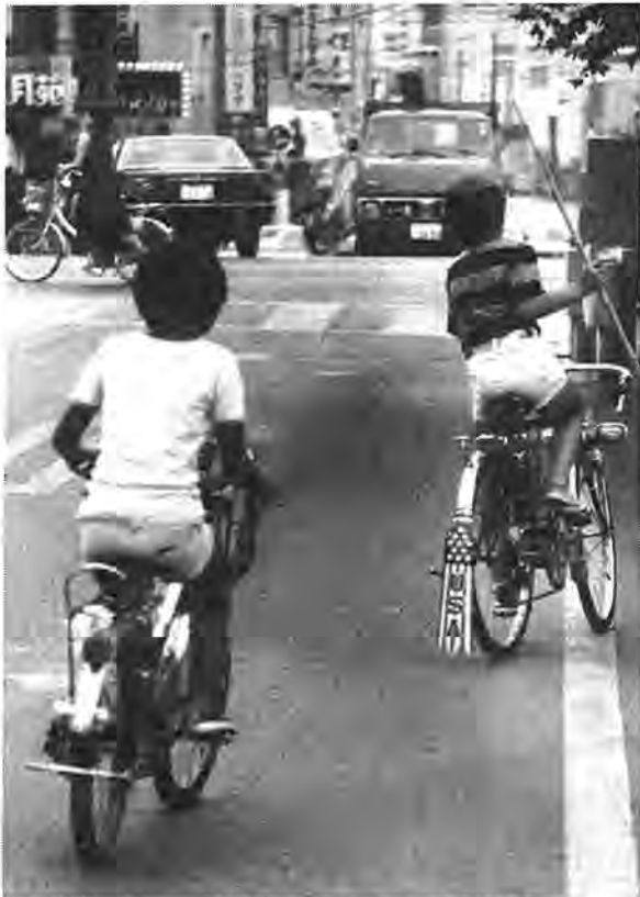
自転車の子供たちの生活の中で大切な足、となっているのですが……