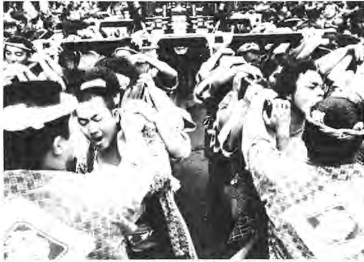
今年もあなたもこの中に入って みては 一昨年の柏まつり

ふるさと柏の夏を彩る「柏まつり」が今年も八月九日、十日の二日間わたって実施されます。商業まつりから模様替えして三回目を迎えるこのまつり、昨年、市が行った市民意識調査では九二%の市民が「知っている」と回答。市民による市民のまつりとして共感を呼び、郷土に定着した感があります。 今年も、市民総参加を一層深めるため、七月に「前しよう戦」というべき、各地区の特色を取り入れた地区まつりを開催。その盛り上がりは二十四万市民が集った市民意識調査では九二%の市民が「知っている」と回答。市民による市民のまつりとして共感を呼び、郷土に定着した感があります。