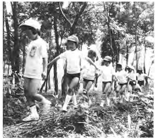
自然は子供たちにとって生きた教材

同校では残り半分の整備をするともに、教職員や児童をはじめ、PTA全会員からアイデア、意見をとり入れて、古タイヤや伐採した丸太などの廃物を利用して手作りの施設を作り、二期期ごころから使えるようにしたいとしています。 山林の中は、夏は涼しく、冬は比較的暖かいというのが特徴。これから作る施設を利用す