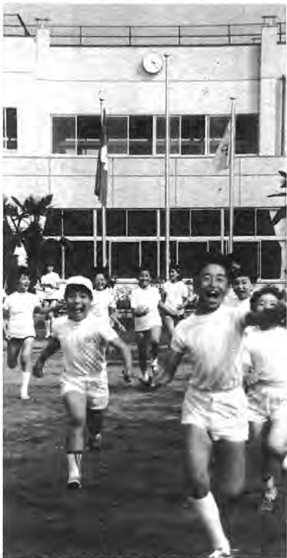
明日の柏を担う子供たちに、充実した教育施設を 写真=今年4月開校した豊小

発行/ 柏市役所(〒277 千葉県柏市柏5-10-1 ☎0471-67-1111) 編集/ 企画調整部広報課 発行日/ 毎月日・11日・21日