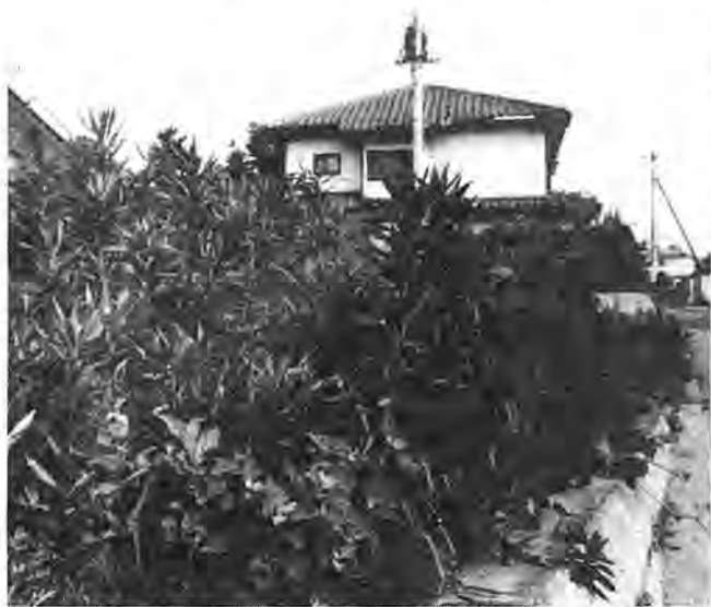
近所迷惑な雑草。苦情が出る前に処理しましょう

梅雨に入り、空き地の雑草が目だつ季節となってきましたが、あなたの土地の管理は万全でしょうか。