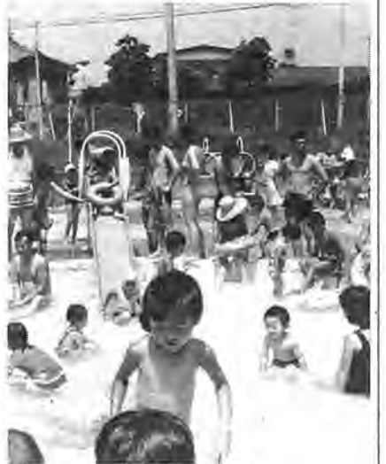
家族連れで楽しめる市民プール

水泳シーズンの到来。柏にも海があればいいのになあ——なんて思っている方が多いのでは。わざわざ遠くに出かけなくても、海水浴の気分が味わえる「市民プール」があるよ。暑い夏の日、水しぶきを上げながら思いっきり市民プールで泳いでみないか。きつとすずしい夏が過ごせるよ。 今年も、七月六日から九月七日まで(毎週月曜日は休み)開場します。時間は、午前九時から午後五時まで、二時間ごとの三回入れ替え制です。 ●場所▽東口市民プール(67-180-24) 柏駅東口から市内循環バスで「緑ヶ丘」下車、徒歩約二分。▽西口市民プール(44-575-9) 柏駅西口から柏中央面へ徒歩約八分 ●料金 大人 四十円 中学生以下 二十円 ●注意▽プール内ではルールを守り、監視員の指示に従って下さい。▽駐車場がありませんので、自動車や自転車での来場はご遠慮を。▽東口プールの入場券は、自動販売機で発売します。また、西口プールの更衣ロッカーはコインロッカーとなりますので、小銭(十円玉)を用意するようにお願いします。