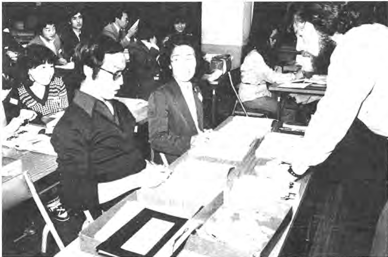
人気の高い公民館の語学講座・英会話コース 一柏公民館で

柏市のうごき (3月31日現在) 人口 / 237,528人 男120,765人 女116,763人 世帯数 / 68,611世帯 (前月より-211人) (前月より-222世帯) 発行 / 柏市役所(〒277 千葉県柏市柏5-10-1 ☎0471-67-1111) 編集 / 企画調整部広報課 発行日 / 毎月1日・11日・21日