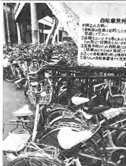
消えることになる北口下の自転車駐車場

開設後しばらくは、柏警察署と駐車場案内を兼ね自転車の置き方を指導を行うことにしています。