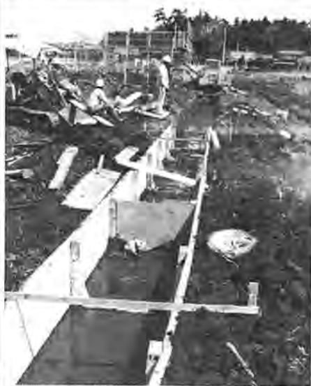
建設が始まったモデル浄化施設