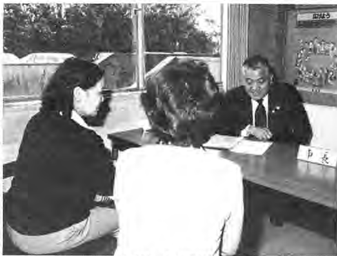
昨年度、要望・意見は一人当りにすると2件。熱の入った市民との対話に制限時間を過ぎることも